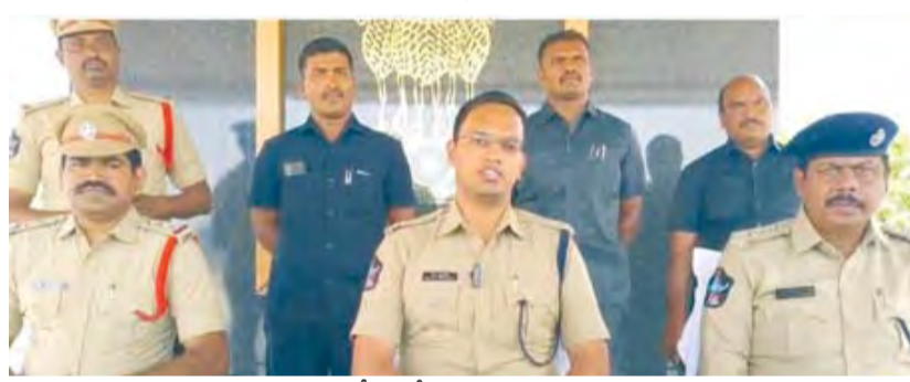
సమావేశంలో మాట్లాడుతున్న ఎస్పీ