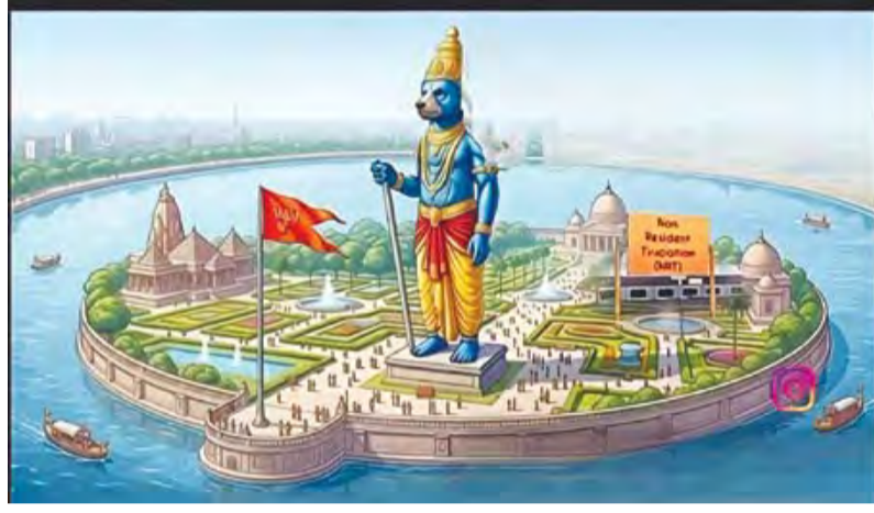
ఓంటిమిట్ట చెరువులో ఏర్పాటు చేయనున్న 108 అడుగుల జాంబవంతుని విగ్రహం ఆకృతి

విగ్రహం వద్దకు వెళ్ళాలంటే జాతీయ రహదారి వద్దకు చేరాలి. ఇక్కడే మరో చారిత్రక ఇతివహనం ఉంది. త్రేతాయుగంలో దండకారణ్యంలో సీతా రాముడు వెతుకుతూ సీతమ్మకు దాహం వేస్తుంది. దీంతో శ్రీరామవంశుడు సీతమ్మ దప్పిక తీర్చేందుకు రామబాణాన్ని సంధిస్తారు. రామబాణం పడినచోట జలం ఉద్భవించింది. అందుకే ఈ చోటకు రామతీర్థం అని పేరు వచ్చింది. ఓంటిమిట్ట కోడండ రామాలయాన్ని టీటిడిలో విలీనం చేసే నాటికి రామతీర్థం శిలావస్థకు చేరుకుంది. టీటిడి రామ తీర్థానికి ఉన్న ప్రాధాన్యతను దృష్టిలో ఉంచుకుని అభివృద్ధి చేసే ఎవరూ వెళ్ళకుండా రక్షణ ఏర్పాటు చేసినందుకే రామతీర్థం వద్ద నుంచి జాతీయ రహదారి మీదుగా జాంబవంతుని విగ్రహం వద్దకు రహదారిని నిర్మించాలని ఇంజనీరింగ్ అధికారులు అంచనాలు రూపొందించారు. బలాండ్ చారిత్రక నేపథ్యాలన్నింటినీ పర్యాటకులకు తెలిపేందుకు 20.17 కోట్లతో ఓంటిమిట్ట చెరువులో జాంబవంతుని విగ్రహం ఏర్పాటు చేయాలని టీటిడి నిర్ణయించింది.