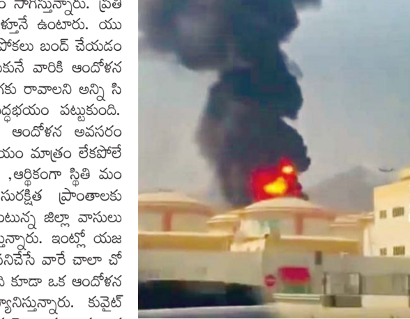
కువైట్ లోని అమెరికా సైనిక స్థావరంపై ఇరాన్ దాడిలో ఎగసిపడుతున్న మంటలు

రాజంపేట, మార్చి 3 ప్రభాతవార్త: ఊహల కోసం కువైట్ కి వెళ్ళిన కడప వాసులు గజగజ వణికి పోతున్నారు. యుద్ధం భయంతో, యుద్ధం వార్తలతో ఇక్కడ గడగడలాడిపోతున్నారు. కువైట్లో ఉంటున్న తమ వారికి ఏమీ జరుగుతుందోనన్న ఆందోళన రోజు రోజు పెరుగుతోంది. యుద్ధం ప్రారంభమై మూడు రోజులైనా మంగళవారం ఇరాన్ కువైట్లోని అమెరికా సైనిక స్థావరంపై బాబులు వర్షం కురిపించడంతో ఆరుమంది అమెరికన్ సైనికులు మరణించారు. ఈ విషయం సామాజిక మాధ్యమాల ద్వారా తెలియడంతో ఇంకా భయం ఎక్కువైంది. ఫలితంగా కువైట్లోని అమెరికన్ ఎంబసి కార్యాలయం కూడా మూసివేస్తున్నట్లు అమెరికా ప్రకటించింది. ప్రతిరోజు బాబులు శబ్దం వినిపిస్తూనే ఉన్నట్లు కువైట్ లో ఉంటున్న వారు ఇక్కడికి సమాచారం తెలియజేస్తున్నారు. అయితే కువైట్ ప్రభుత్వం ఎప్పటికప్పుడు అక్కడివారికి వస్తూ సమాచారాన్ని అందిస్తోంది. దీనికి తోడు మంగళవారం కువైట్ రాజాత్ ప్రధాని మోడీ కూడా మాట్లాడారు. కువైట్లో ఉంటున్న భారతీయులకు ఎలాంటి ప్రమాదం జరగకుండా చూడాలని కోచారు. ఈ వార్త కొంతవరకు కువైట్ లో ఉంటున్న వారి బంధుమిత్రులకు ఊరటనిచ్చింది. ఇప్పటివరకు జనాభాసాధారణ ఎలాంటి దాడులు జరగలేదని పోయినా టిక్కెట్ల బిక్కు మంటనే గడుపుతున్నాయి.