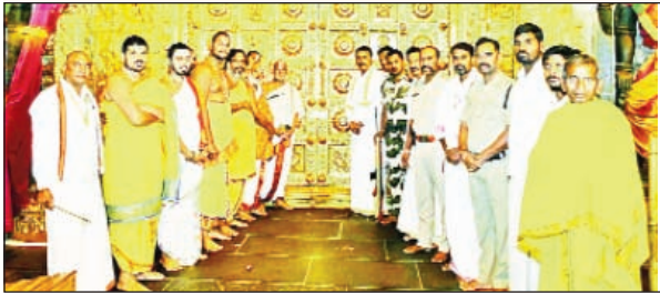
యాదగిరిగుట్ట ఫిబ్రవరి 3 (ప్రభాతవార్త) :