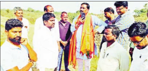
ఆలేరు, మార్చి 3, ప్రభాతవార్త :