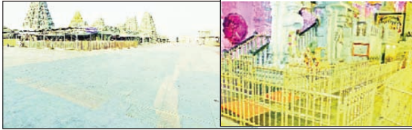
యాదగిరిగుట్ట ఫిబ్రవరి 3 ప్రభాతవార్త

యాదగిరిగుట్ట లక్ష్మీమీనరసింహస్వామి దేవస్థానంలో మంగళవారం సంపూర్ణ చంద్రగ్రహణం పురస్కరించుకొని ఆలయాన్ని ఆలయ అర్చకులు మూసి వేశారు. దీంతో గర్భా లయం ఆలయ పరిసరాలు విష్ణు పుష్కరణ క్యూలైన్లు తదితర దేవాలయ ప్రాంతాలన్నీ భక్తులు లేకుండా వేలవేల బోయాయి భక్తులు రాని కారణంగా ఆలయ పరిసరాలన్నీ నిర్మానుష్యంగా మారిపోయాయి. భక్తులతో నిరంతరం సందడిగా ఉండే యాదాద్రి కొండ భక్తులు లేకుండా ఆలయ పరిసరా లన్నీ బోసిపోయాయి. ఆరాధనలు పూజలు ప్రతాలు లేకుండా స్వామివారి దేవస్థానం నిర్మానుష్యంగా మారిపోయింది. దుకాణ సముదాయాలను మూసివేశారు. అన్నదాన సత్రం, లడ్డు పులిహోర ప్రసాదాల తయారీ విభాగాలు మూసివేయబడ్డాయి. నిరంతరం భక్తుల స్నానాలతో కిట కిటలాడే విష్ణు పుష్కరుని భక్తుల సర్వ నిర్మానుష్యంగా మారింది. తలనీలాల కళ్యాణ కట్టలు లేక భక్తులు లేక బోసిపో యింది. నిరంతరం భక్తులతో కళకళలాడే సత్యనారాయణ స్వామి ప్రత మండపం లో భక్తులు లేక ప్రతాలు లేక బోసిపోయింది. తులసి కాటేటీ లోని వసతి గదులన్నీ ఖాళీగా మారాయి. మొత్తానికి సంపూర్ణ చంద్రగ్రహణం యాద గిరిగుట్ట దేవస్థానం ఆదాయం మీద దెబ్బ పడినట్లు అయింది.