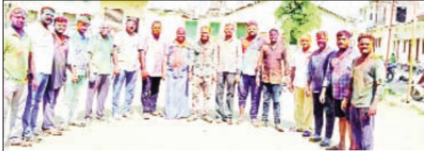
ఆలేరు, మార్చి 3, ప్రభాతవార్త :