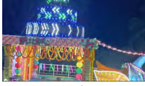
మలపాక విశ్వ భారతి ఆధ్వర్యంలో కార్యక్రమాలు జరిగాయి.