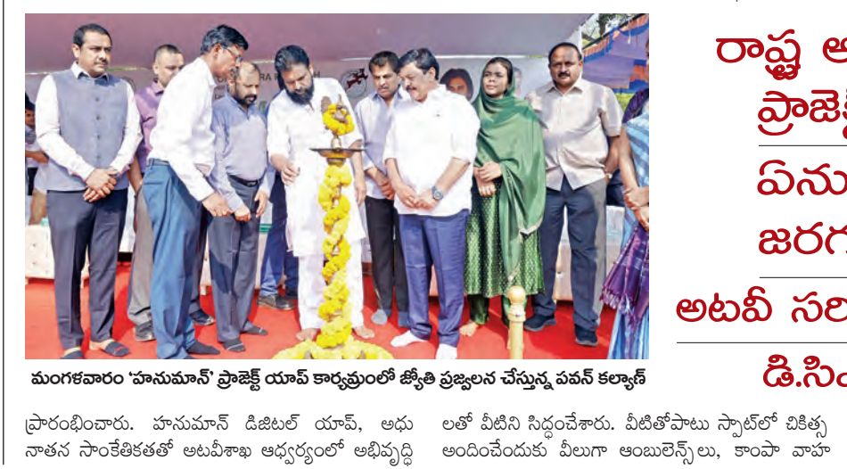
మంగళవారం హనుమాన్ ప్రాజెక్ట్ యావం కార్యక్రమంలో జ్యోతి ప్రజ్వలన చేస్తున్న పవన్ కల్యాణ్

నాలు ఉన్నాయి. మొదట రాష్ట్ర డిజిటల్ రెస్పాన్స్ వాహనాలు, హనుమాన్ ఆంబులెన్స్ లను పరిశీలించి సౌకర్యాలను అడిగి తెలుసుకున్నారు. ఆంధ్రప్రదేశ్ అటవీ శాఖ పరిధిలో నంద్యాల జిల్లాలో వన్యప్రాణులు వివరాలు, సంరక్షణకు తీసుకుంటున్న చర్యలు, రెస్పాన్స్ ఆపరేషన్ లో మినియోగింట్ టిట్లు, జనావాసాల్లోకి వచ్చిన పులులు లాంటి వన్య మృగాలను బంధించే బోస్సు, అటవీశాఖ పరిధిలో పెరిగి జోషియా మొక్కలు, ఉత్పత్తుల వివరాలను అధికారులు, ఎన్ఫోర్స్ మెంట్ గ్యాలరీల రూపంలో పవన్ కల్యాణ్ కి వివరించారు. ఈ క్రమంలో ఘాట్స్ లో సం