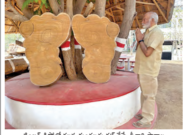
టింబర్ డిపోలో కలవ దుంగలను కట్ చేస్తే శ్రీవారి పాదాల నమూనా ప్రత్యక్షం కావడంతో వాటికి సమస్యనిర్మూలన డిపో యజమాని