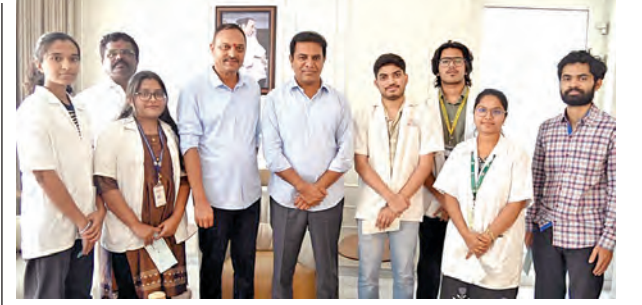
బుద్ధవారం లక్ష్యాధిని నివాసంలో బిఎల్ఆర్ చారిటబుల్ ట్రస్ట్ ఆధ్వర్యంలో 16 మంది ఎంపీలను విద్యార్థులకు చెక్కలు అందజేసిన మాజీ మంత్రి కెటిఆర్

చేస్తున్న రాజకీయం మీది అంటూ నిందించారు. దేశ ఐక్యత కోసం కన్యాకుమారి నుండి శాశ్వత వరకు పాదయాత్ర చేసి దేశ ప్రజలకు ఐక్యతను చాటి మీ ప్రభుత్వానికి నిద్ర లేకుండా చేస్తున్న రాజకారాణం గాంధీ గారిని విమర్శించడం తగదని అన్నారు. ఆశాఠం మీద ఉమ్మడి మీ ముఖం మీదే పడుతుంది ఆ వాస్తవాన్ని బండి సంజయ్ తెలుసుకోవాలని కోరారు. రెండు సార్లు ఎంపీగా గెలిచి కేంద్ర మంత్రి అయి తెలంగాణ కు ప్రత్యేక నిధులు తీసుకురాని దద్దమ్ము బండి సంజయ్ మీ వ్యవహారాలపై మార్పుకోవాలని హితవు చెప్పారు.