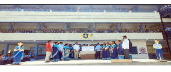
శ్రీసాయి యేసు ఇంగ్లీష్ మీడియం హైస్కూల్