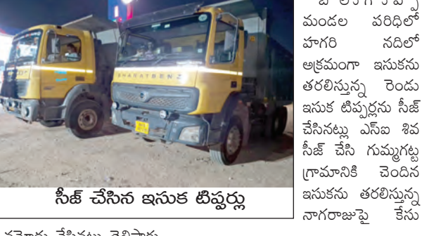
సీజ్ చేసిన ఇసుక టిప్పుర్లు