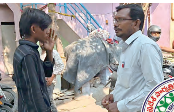
ఆశల వలలో చిక్కి విలవిలలాడుతున్న విద్యార్థులు