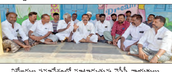
విలేజులకు సమావేశంలో మాట్లాడుతున్న వైసీపీ నాయకులు