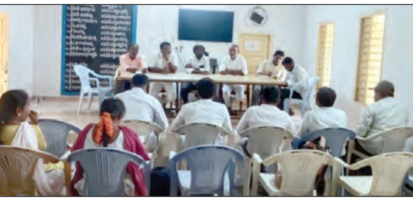
పరీక్షా కేంద్రాన్ని సందర్శించిన దృశ్యం