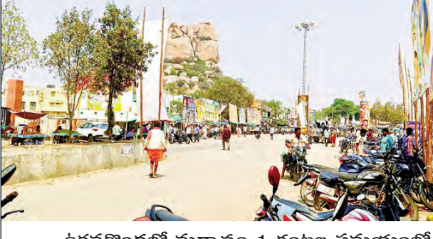
ఉరవకొండలో మధ్యాహ్నం 1 గంటల సమయంలో ప్రధాన రోడ్డులో రద్దీ లేని దృశ్యం