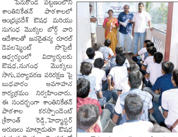
బేషం సుగంధ మొక్కల సాగుపై అవగాహన కల్పిస్తున్న దృశ్యం