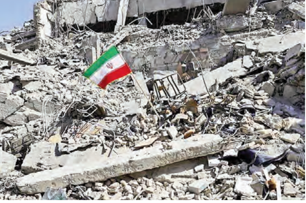
అమెరికా, ఇజ్రాయెల్ దాడులతో ఇరాన్ లో శిథిలమైన భవనం చెందిన ఇమామ్ రెజా డ్రైన్ స్థావరంలోని ఖననం చేసారని, ఈ ప్రాంగణం పీయా మిస్సైలుల అత్యంత వచిత్ర యాత్రాకేంద్రంగా కూడా భాసిల్లుతోంది. ఇస్రామిక్ రివ్యూట్ నేత గార్గుల పర్యవేక్షణలో అధికార చర్యలతోనే అంతర్జాతీయ జరుగుతాయి.

కోత్తనేతను ఎంపికచేసారు. దివంగత ఖాన్ సుల్తాన్ కుమారుడు ముఖ్య ఖాన్ సుల్తాన్ నియమించుకుంటున్నట్లు గల్ఫ్ మీడియా ప్రకటించింది. సుప్రీం లీడర్ ఎంపిక ముగిసినపిమ్మట మండలి నిర్ణయిస్తుంది. ఐఆర్ జిసి ముఖ్యభాను ఎంపికచేయాలన్న ఒత్తిడితో ఆతనికే మొగ్గుచూపించినట్లు తెలుస్తోంది. అలాగే సైన్యం తోను, రక్షణశాఖలోని ఇతర బృందాలతో ముఖ్యభాను ఉన్న సానిటోకామే ఆతనిని ఎంపికచేసినట్లు తెలుస్తోంది. ఇదిలా ఉంటే ఇరాన్ సుప్రీం లీడర్ గా ఎవరిని నియమించినా మట్టుపెట్టేస్తామని ఇజ్రాయెల్ రక్షణ మంత్రి కాట్స్ ప్రకటించారు. ఇరాన్ లో ఇకపై నియం తపోలన అనేది ఉండకూడదన్నదే తన లక్ష్యమని ప్రకటించింది. ఇస్రామిక్ రివ్యూట్ తండ్రినుంచి కుమారుడికి అధికారం బదులి కావడం ఇదే తొలిసారి. తెరవెనుక కీలకంగా ఉన్నముఖ్యభాను ఇప్పుడు నేరుగా సుప్రీం పగ్గాలుచేపట్టారు.