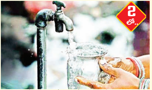
ఆన్లైన్లో కాకుండా చేతిరాతతో కూడిన రశీదు పుస్తకాల

కార్యాలయాల చుట్టూ పడిగాపులు: మార్చి నెల కావడంతో పన్ను వసూళ్లపై అధికారులు ఒత్తిడి పెంచుతున్నారు. అయితే, ఆన్లైన్ వ్యవస్థ సక్రమంగా లేకపోవడంతో ప్రజలు తప్పనిసరి పరిస్థితుల్లో కార్పొరేషన్ కార్యాలయం మెట్లు ఎక్కాల్సి వస్తోంది. చేతిలో అయిపోయే పనికి గంటల తరబడి వేచి చూడాల్సి వస్తోందని సామాన్యులు వాపోతున్నారు. కార్యాలయం చుట్టూ తిరగలేక, అగచాట్లు పడలేక ప్రజలు విసిగిపోతున్నారు. ఖజానాకు చేరుతున్నాయా...?