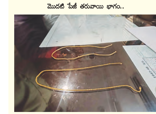
నిందితులనుంచి స్వాధీనం చేసుకున్న బంగారు గొలుసులు