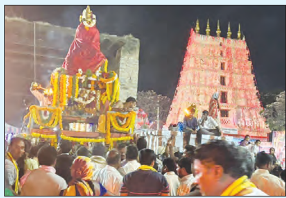
మామిళ్ళపల్లిలో భారీ జన సమాహం, కేరింతల మధ్య జరిగిన రథోత్సవం.