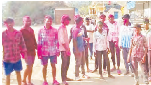
హోలీ సందర్భంలో యువకులు

ధన్వాడ, మార్చి 4 ప్రభాతవార్త : ధన్వాడ మండలంలో నిన్ను పండ్లగ్రహణం ఉండటంతో పలు గ్రామాలలో బుధవారం హోలీ వండుగను గ్రామస్థులు సాంప్రదాయ బద్ధంగా అంగరంగ వైభవంగా జరుపుకున్నారు. చిన్నా, పెద్దా అనే తేడా లేకుండా అందరూ కలిసి రంగులు చల్లుకుంటూ వండుగ ఆనందాన్ని పంచుకున్నారు. ఉదయం నుంచే గ్రామ వీధులన్నీ రంగులతో కళకళలాడాయి. యువత సీటి పిచ్చారితో సందడి చేస్తే, చిన్నారులు రంగుల పొడులతో కేరింతలు కొట్టారు. గ్రామంలోని పెద్దలు కూడా వండుగలో పాల్గొని, ఇక్కడకు ప్రతీకగా ఒకరికి ఒకరు రంగులు రాసుకుంటూ శుభాంక్షలు తెలుపుకున్నారు. హోలీ వేడుకల సందర్భంగా గ్రామంలో ఉత్సాహభరిత వాతావరణం నెలకొంది.