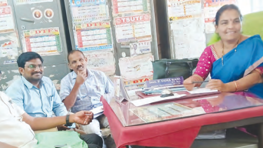
ప్రైవేట్ పాఠశాలల కరస్పాండెంట్లతో ప్రత్యేక సమావేశం నిర్వహిస్తున్న ఎంకాజీ

భూత్పూర్, మార్చి 4, ప్రభాతవార్త : ప్రభుత్వ అదేశాల మేరకు ప్రైవేట్ పాఠశాలలు తమ పాఠశాల వివరాలు, సంబంధిత అటాచ్ కాపీలతో వెంటనే తమ కార్యాలయంలో సమర్పించాలని భూత్పూర్ మండల విద్యాధికారికి పి ఉపారాజి మండలంలోని ప్రైవేట్ పాఠశాలల యాజమాన్యాలను అదేశించారు. బుధవారం మండల కేంద్రంలోని ఎమ్మార్సీ భవనంలో మండల ప్రైవేట్ పాఠశాలల కరస్పాండెంట్లతో ప్రత్యేకసమావేశం నిర్వహించారు. ఈ సందర్భంగా ఎంకాజీ ఉపారాజి మాట్లాడుతూ కొందరు కరస్పాండెంట్లు తమ పాఠశాలల వివరాలు ప్రభుత్వం తెలిసిన 32 అంశాలలో కూడిన ఫార్మాట్ ను ప్రింట్ తీసుకుని అన్ని వివరాలను నింపి సంబంధిత డాక్యుమెంట్స్ అటాచ్ చేసి ప్రైవేట్ వెంటనే సమర్పించాలని సూచించారు. మాడో తరగతి విద్యార్థులకు రాష్ట్రవిద్యాశాఖ అదేశాలమేరకు ఎఫ్ఎల్ఎస్ మాకెట్ పెంట్ నిర్వహించాలని అదేశించారు. మాకెట్ పెంట్ వివరాలను