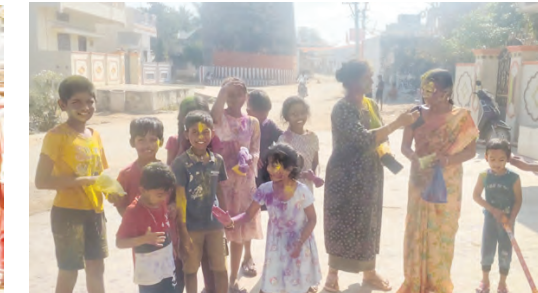
ఉప్పునుతలలో రంగుల కార్యక్రమంలో పాల్గొన్న చిన్నారులు