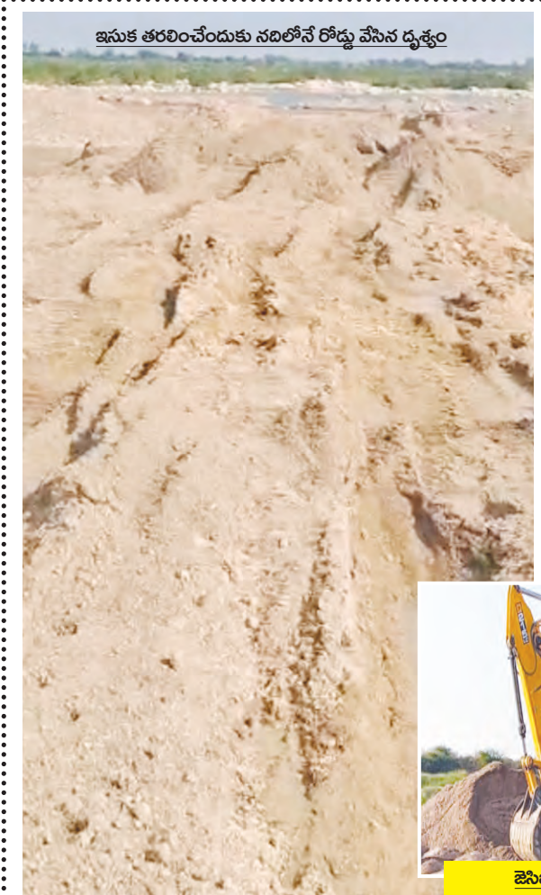
ఇసుక తరలింపేందుకు నదిలోనే రోడ్డు వేసిన దృశ్యం