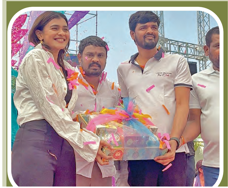
షాద్ నగర్ హోల్ వేడుకల్లో పాల్గొన్న సినీనటి హాబ్బా పటేల్