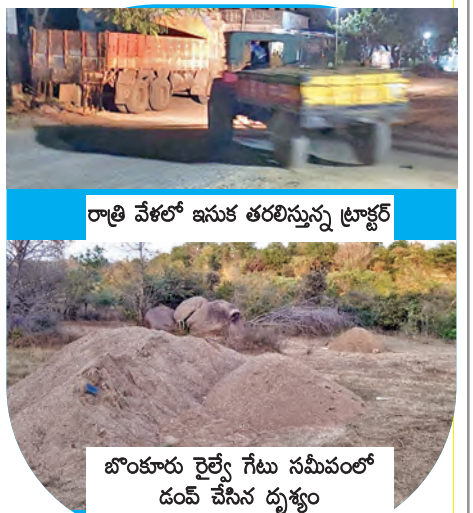
రాత్రి వేళలో ఇసుక తరలిస్తున్న ట్రాక్టర్

పెద్దేమల్, మార్చి 4, ప్రభాతవార్త: అక్రమ ఇసుక రవాణాలో ఇసుకాసురులు పెట్టిగిరినన్నారు. రాత్రి పగలు తేడా లేకుండా ఇంజనీరింగు దర్జాగా ఇసుకను తరలిస్తున్నారు. రాత్రింబవళ్లు అక్రమ ఇసుక రవాణాలో కంటికి కనుకులేకుండా పోతోందని ఆయా గ్రామాల ప్రజలు వాపోతున్నారు. రాత్రి వేళలో ఒకదాని వెనుక ఇసుక ట్రాక్టర్లు వెళ్లడం మాన్పి ఏరువాక బండ్లను తలపిస్తున్నాయి. పెద్దేమల్ మండలంలోని రుక్కాపూర్ సమీపంలో గల బొంకూరు కాగానది నుంచి జెసిలీలతో అక్రమంగా ఇసుకను తోడస్తున్నారు. వారు నుంచి తోడేసిన ఇసుకను బొంకూరు రైల్వే గేటు సమీపంలో డంపులుగా వేసి నిల్వచేస్తున్నారు. డంపులుగా వేసిన ఇసుకను రాత్రి వేళలో దర్జాగా తరలిస్తూ సొమ్ము అనుమతులు లేకుండా రాత్రి వేళలో రవాణా బొంకూరు రైల్వే గేటు సమీపంలో డంప్ ఇసుక మాఫియాకు అడ్డాగా మాలిన మంబాపూర్ పోలీసు చెకిపోస్టు తీసియడంతో యధేచ్ఛగా దండా ట్రాక్టర్ రూ.7 వేల వరకు విక్రయం ప్రభుత్వ బుజ్జానాకు భారీగా గండి అడపా దడపా టాన్స్ ఫార్మ్స్ దాడులు అడ్డుకట్ట వేయడంలో స్థానిక అధికారులు విఫలం