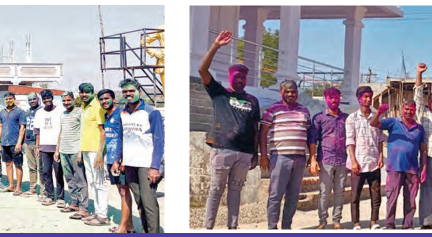
సంబురాలలో భాగంగా పాల్గొన్న యువకులు.