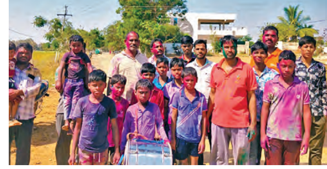
షాబాద్: హోలీ వేడుకల్లో పాల్గొన్న చిన్నారులు