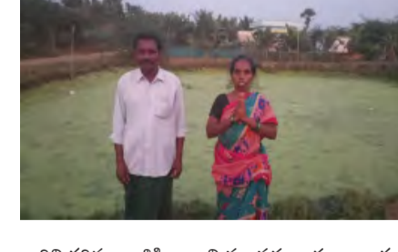
వారిని కఠినంగా శిక్షించాలని మా వద్ద రాయబారాలకు కావు లేదని తెలియజేశారు.