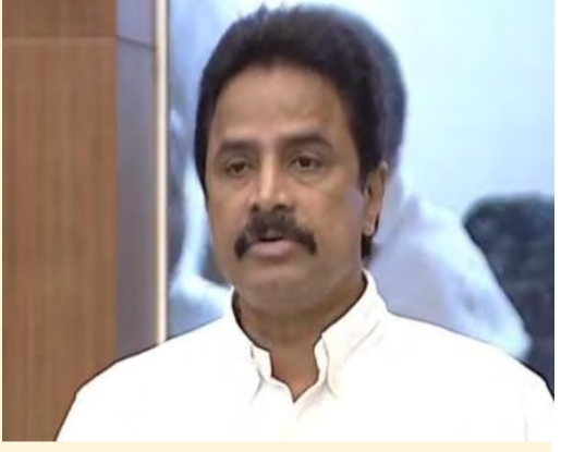
కోటి సంతకాల సేకరణ కార్యక్రమం జగన్మోహన్ రెడ్డి చేపట్టారని ఎమ్మెల్యే రాధాకృష్ణ గుర్తు చేశారు.

కోట్లు ఖర్చు అవుతుందని అంచనా వేసింది అని గుర్తు చేశారు. ఇందుకు సంబంధించి దాఖలు రూ. 5 వేల కోట్లు అప్పులు కూడా తీసుకున్నట్లు తెలుస్తోందన్నారు. కేంద్రం నుంచి రూ. 975 కోట్లు తీసుకోవడంతో పాటు ఆరోగ్యశ్రీ నిధులను మళ్లించారని చెప్పారు. గత ప్రభుత్వంలో తీసుకువచ్చిన రూ. 4,948 కోట్లు అప్పు కళాశాలలకు ఖర్చు చేశారా లేక వేరే దానికి మళ్లించారా అనేది మంత్రి తెలియజేయాలని కోరారు. పిపిపి విధానంలో ఏ ఏ సంస్థలకు మెడికల్ కాలేజీలను అప్పగించారు, ఎప్పుడు అందుబాటులోకి వస్తాయో తెలియజేయాలని కోరారు. పీజీ సీట్లకు సంబంధించిన నిధులు గత ప్రభుత్వంలో మళ్లించారని ఆరోపించారు. గత ప్రభుత్వ హయాంలో పీజీ సీట్లకు సంబంధించి కేంద్రం చెల్లించిన నిధులు మళ్లించిన విషయం వాస్తవమేనా అనే ప్రశ్నించారు. సంబంధిత అంశాలపై ఎలాంటి చర్యలు తీసుకుంటున్నారో తెలియజేయాలని కోరారు. పీపీపి విధానాన్ని అడ్డుకోవడానికి