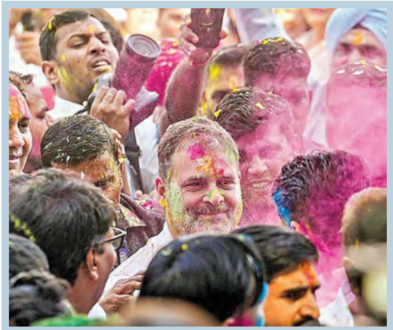
స్వాధీల్లోని పార్టీ కార్యాలయంలో బుధవారం జరిగిన హోలీ వేడుకల్లో పాల్గొన్న రాహుల్ గాంధీ