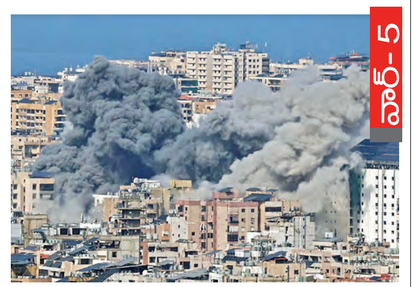
వార్త-5 ఇజ్రాయెల్ దాడి అనంతరం బీరుట్ ప్రాంతాల్లో ఎగసిపడుతున్న షాగలు