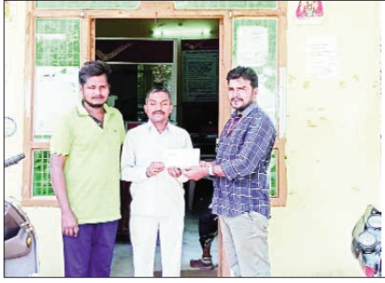
విద్యార్థిని విద్యార్థులకు ఉదయం వేళల్లో,సాయంత్రం వేళల్లో స్పెషల్ క్లాసులు నిర్వహించాలని,విద్యాశాఖ అదీశాలు ఉన్నప్పటికీ