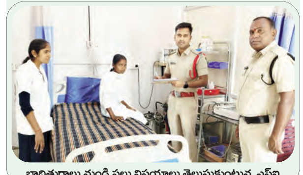
బాధితురాలు నుండి పలు విషయాలు తెలుసుకుంటున్న ఎస్ఐ