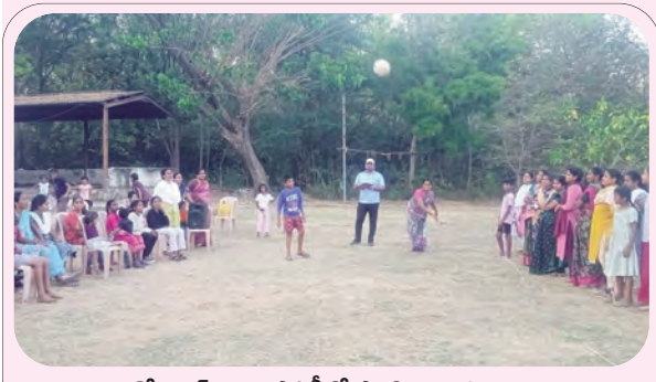
శ్రీ బాల్ ఆటల పోటీలో పాల్గొన్న మహిళలు

నిర్వహణ వంటి అంశాలు, గ్రామీణ అభివృద్ధి శాఖ ఆధ్వర్యంలో కూలీల నిర్వహణ, మెటీరియల్ కాంపోసెంట్ వినియోగం, మూత్రశాలలు, కిచెన్ షెడ్యూల్ నిర్మాణం, ఫ్లాంటేషన్ ప్రోగ్రాం, సామాజిక ఇంకుడు గుంతల నిర్వహణ, జిల్లా విద్యాశాఖ ఆధ్వర్యంలో పేరెంట్ టీచర్ సమన్వయ సమావేశం, అసంపూర్ణిగా ఉన్న నిర్మాణాల పురోగతి, మండల స్థాయిలో సౌకర్యాల కల్పన తదితర అంశాలపై కార్యచరణ రూపొందించాలని తెలిపారు. గృహ నిర్మాణ సంస్థ ఆధ్వర్యంలో ఇందిరమ్మ ఇండ్ల పనులు త్వరితగతిన పూర్తయ్యేలా ప్రణాళిక రూపొందించాలని, రవాణా శాఖ ఆధ్వర్యంలో కంటిమాపు పరీక్షలు నిర్వహణ, ఎక్కువ సంఖ్యలో వాహనాలు ఆగే ప్రదేశాలలో డ్రైవర్లకు అవగాహన కల్పించడం, డ్రంక్ అండ్ డ్రైవ్ పై కఠినంగా వ్యవహరించడం, రోడ్డు ప్రమాదాలు జరగకుండా చర్యలు తీసుకోవడం, జిల్లా పౌరసరఫరాల శాఖ ఆధ్వర్యంలో చేయబడిన నూతన రేషన్ కార్డులు, సన్న బియ్యం పంపిణీ వివరాలు, గ్రామపంచాయతీ, మున్సిపల్ వార్డుల వారిగా వివరాలతో సిద్ధం చేయాలని తెలిపారు. జిల్లా అధికారులు తమ పరిధిలోని కార్యాలయంలో, కార్యాలయాల పరిసరాలలో పారిశుధ్యం నిర్వహణ, పెండింగ్లో ఉన్న ఫైల్స్ క్లియర్ చేయడం వంటి వాటిని పూర్తి చేయాలని, అంతర్గత సమావేశాలు నిర్వహించి 99 రోజుల ప్రణాళిక తయారు చేసి, పక్కాగా అమలు అయ్యేలా సిద్ధంగా ఉండాలని తెలిపారు. ఈ కార్యక్రమంలో వివిధ శాఖల జిల్లా అధికారులు, సంబంధిత అధికారులు తదితరులు పాల్గొన్నారు.