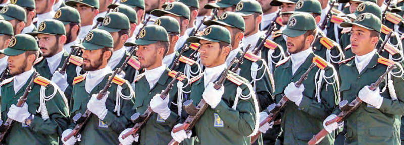
విదేశీ విభాగం), రెండోది ఖాసీజీ మిలిటరీ (అంతర్గత విభాగం). ఇరాన్ వెలుపల లెబనాన్, సిరియా, ఇరాక్, యెమెన్ వంటి దేశాల్లో సైనిక, పూర్వభూత కార్యకలాపాలను ఖుద్స్ ఫోర్స్ నిర్వహిస్తుంది. హిజ్బుల్లా, హమాస్ వంటి సంస్థలకు మద్దతు ఇవ్వడంలో ఇది కీలకం. దేశంలో తలెత్తే నిరసనలను అణిచివేసేందుకు, విప్లవ వ్యతిరేక కార్యకలాపాలను అడ్డుకోవడానికి ఖాసీజీ మిలిటరీ యాన ఉపయోగిస్తారు. ఐఆర్జిసి అతిపెద్ద బలం దాని అధికారక్రమం. ఇది ఇరాన్ ప్రభుత్వానికి లేదా అధ్యక్షుడికి జవాబు దారీ కాదు. ఇది నేరుగా దేశ అత్యున్నత నాయకుడైన సుప్రీం లీడర్ ఆదేశాల మేరకు పనిచేస్తుంది. దీనివల్ల దేశ విదేశాంగ విధానంలో, అంతర్గత రాజకీయాల్లో ఐఆర్జిసి మాటకే మొగ్గు ఉంటుంది. వాస్తవానికి, ఇరాన్ అణు కార్యక్రమం, క్షిప్ర వ్యవస్థల నియంత్రణ కూడా వీరి చేతుల్లోనే ఉంటుంది. ఐఆర్జిసి కేవలం అయుధాలతోనే కాకుండా, ఆర్థిక బలంతోనూ దేశాన్ని శాసిస్తోంది. ఇరాన్ పై అంతర్జాతీయ ఆంక్షలు ఉన్నప్పటికీ, దేశంలోని చమురు, గ్యాస్, నిర్మాణం, టెక్స్ టిల్, పూర్వభూత కార్యకలాపాలను ఖుద్స్ ఫోర్స్ నిర్వహిస్తుంది. హిజ్బుల్లా, హమాస్ వంటి సంస్థలకు మద్దతు ఇవ్వడంలో ఇది కీలకం. దేశంలో తలెత్తే నిరసనలను అణిచివేసేందుకు, విప్లవ వ్యతిరేక కార్యకలాపాలను అడ్డుకోవడానికి ఖాసీజీ మిలిటరీ యాన ఉపయోగిస్తారు. ప్రస్తుతం మధ్యప్రాచ్యంలో మారు తున్న రాజకీయ సమీకరణాల వల్ల ఐఆర్జిసి తీవ్ర ఒత్తిడిని ఎదుర్కొంటోంది. ముఖ్యంగా ఇజ్రాయెల్, అమెరికాతో పెరుగుతున్న ఉద్రిక్తతలు, అంతర్గతంగా ప్రజల్లో వస్తున్న మార్పులు ఈ పనిచేస్తుంది. దీనివల్ల దేశ విదేశాంగ విధానంలో, అంతర్గత రాజకీయాల్లో ఐఆర్జిసి మాటకే మొగ్గు ఉంటుంది. వాస్తవానికి, ఇరాన్ అణు కార్యక్రమం, క్షిప్ర వ్యవస్థల నియంత్రణ కూడా వీరి చేతుల్లోనే ఉంటుంది. ఐఆర్జిసి కేవలం అయుధాలతోనే కాకుండా, ఆర్థిక బలంతోనూ దేశాన్ని శాసిస్తోంది. ఇరాన్ పై అంతర్జాతీయ ఆంక్షలు ఉన్నప్పటికీ, దేశంలోని చమురు, గ్యాస్, నిర్మాణం, టెక్స్ టిల్, పూర్వభూత కార్యకలాపాలను ఖుద్స్ ఫోర్స్ నిర్వహిస్తుంది. హిజ్బుల్లా, హమాస్ వంటి సంస్థలకు మద్దతు ఇవ్వడంలో ఇది కీలకం. దేశంలో తలెత్తే నిరసనలను అణిచివేసేందుకు, విప్లవ వ్యతిరేక కార్యకలాపాలను అడ్డుకోవడానికి ఖాసీజీ మిలిటరీ యాన ఉపయోగిస్తారు. ప్రస్తుతం మధ్యప్రాచ్యంలో మారు తున్న రాజకీయ సమీకరణాల వల్ల ఐఆర్జిసి తీవ్ర ఒత్తిడిని ఎదుర్కొంటోంది. ముఖ్యంగా ఇజ్రాయెల్, అమెరికాతో పెరుగుతున్న ఉద్రిక్తతలు, అంతర్గతంగా ప్రజల్లో వస్తున్న మార్పులు ఈ పనిచేస్తుంది. దీనివల్ల దేశ విదేశాంగ విధానంలో, అంతర్గత రాజకీయాల్లో ఐఆర్జిసి మాటకే మొగ్గు ఉంటుంది. వాస్తవానికి, ఇరాన్ అణు కార్యక్రమం, క్షిప్ర వ్యవస్థల నియంత్రణ కూడా వీరి చేతుల్లోనే ఉంటుంది. ఐఆర్జిసి కేవలం అయుధాలతోనే కాకుండా, ఆర్థిక బలంతోనూ దేశాన్ని శాసిస్తోంది. ఇరాన్ పై అంతర్జాతీయ ఆంక్షలు ఉన్నప్పటికీ, దేశంలోని చమురు, గ్యాస్, నిర్మాణం, టెక్స్ టిల్, పూర్వభూత కార్యకలాపాలను ఖుద్స్ ఫోర్స్ నిర్వహిస్తుంది. హిజ్బుల్లా, హమాస్ వంటి సంస్థలకు మద్దతు ఇవ్వడంలో ఇది కీలకం. దేశంలో తలెత్తే నిరసనలను అణిచివేసేందుకు, విప్లవ వ్యతిరేక కార్యకలాపాలను అడ్డుకోవడానికి ఖాసీజీ మిలిటరీ యాన ఉపయోగిస్తారు. ప్రస్తుతం మధ్యప్రాచ్యంలో మారు తున్న రాజకీయ సమీకరణాల వల్ల ఐఆర్జిసి తీవ్ర ఒత్తిడిని ఎదుర్కొంటోంది. ముఖ్యంగా ఇజ్రాయెల్, అమెరికాతో పెరుగుతున్న ఉద్రిక్తతలు, అంతర్గతంగా ప్రజల్లో వస్తున్న మార్పులు ఈ పనిచేస్తుంది. దీనివల్ల దేశ విదేశాంగ విధానంలో, అంతర్గత రాజకీయాల్లో ఐఆర్జిసి మాటకే మొగ్గు ఉంటుంది. వాస్తవానికి, ఇరాన్ అణు కార్యక్రమం, క్షిప్ర వ్యవస్థల నియంత్రణ కూడా వీరి చేతుల్లోనే ఉంటుంది. ఐఆర్జిసి కేవలం అయుధాలతోనే కాకుండా, ఆర్థిక బలంతోనూ దేశాన్ని శాసిస్తోంది.

సైన్యానికి మించిన కీలకపాత్ర వెస్టర్న్, మార్చి 5: ప్రపంచంలో ఏదేశానికైనా సైన్యం ఒకటి ఉంటుంది. కానీ ఇరాన్ లో మాత్రమే సైన్యానికి, ప్రభుత్వానికి సమానతరంగా కొనసాగే వ్యవస్థ ఉంది. అదే, ఇస్ఫాహాన్ రివల్యూషనరీ గార్డ్స్ కోర్ (ఐఆర్జిసి). ఇరాన్ రాజకీయ, సైనిక, ఆర్థిక ముఖ్యతలలో ఐఆర్జిసి అత్యంత కీలకమైన పాత్ర. వాస్తవానికి దేశ సైన్యం కంటే, ప్రభుత్వానికంటే ఈ రివల్యూషనరీ గార్డ్స్ కే ఇతరకారాలు ఎక్కువ. ఈ విషయం సైన్యం కేవలం ఇరాన్ నుంచి లీడర్లకు మాత్రమే జవాబుదారీగా ఉంటుంది. ప్రభుత్వానికి కానీ, ప్రధాని, అధ్యక్షుడు, తదితర వ్యవస్థలకు ఇది ఎలాంటి భాద్యత పోషించదు. దేశ సరిహద్దులను కాపాడుటలో మామూలు ఇస్ఫాహాన్ విప్లవ శకాయాలను రక్షించడం ఐఆర్జిసి ప్రధాన ఉద్దేశ్యం. ఇరాన్ లో 1979లో జరిగిన ఇస్ఫాహాన్ విప్లవం తర్వాత, అప్పటి సుప్రీం లీడర్ అయితో టాడూ ఖమేనేనే ఈ రహస్య స్థాపించారు. అప్పట్లో సాధారణ సైన్యం పాత రాజు (షా) పట్ల విద్వేషం చూపుతుండడం వల్లనే, కేవలం ఇస్ఫాహాన్ వ్యవస్థం, సుప్రీం లీడర్ కు మాత్రమే జవాబుదారీగా ఉండేలా ఈ ప్రత్యేక రహస్య రూపొందించారు. కాలక్రమేణా ఇది దేశంలోని అన్ని విభాగాలపై పట్టు సాధించి, ఒక శక్తిమంతమైన సామ్రాజ్యంగా ఏర్పడింది. ఐఆర్జిసి సైన్యం అప్పుడే, నేటి, ఎయిర్ ఫోర్స్ విభాగాలు ఉన్నాయి. దీనిలోని రెండు ప్రధాన విభాగాలు కాగా, ఒకటి ఖుద్స్ ఫోర్స్ (ఐఆర్జిసి