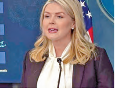
చతురం దానిలో నేపాల్ కు ఆపరేషన్ ముఖ్య ఉద్దేశ్యాలను వివరించారు. ఈ దాడుల్లో వందల కొద్దీ బాలిస్టిక్ క్షిప్రబలు, లాంఛర్లు, డ్రోన్ లను నాశనం చేశామని పేర్కొన్నారు. ఇప్పటివరకు ఆపరేషన్ ఎపిక్ ఫ్యూజి గొప్ప విజయం సాధించిందని అమె అన్నారు. ఈ సైనిక చర్యలో ఇరాన్ నౌకాదళానికి భారీ నష్టం వాటిల్లినట్లు లిబియ్ తెలిపారు. 'రెండో ప్రపంచ యుద్ధం తర్వాత మొదటిసారిగా బార్బాడోస్ ఉపయోగించి, ఇరాన్ ను చెందిన అత్యంత కీలకమైన సబ్మెరిన్ లతో సహా 20కి పైగా నౌకలను ధ్వంసం చేశాం. ప్రస్తుతం అరబ్ యాల్ గల్ఫ్, హోర్ముజ్

అమెరికా అధ్యక్ష భవనం ప్రకటన వాషింగ్టన్, మార్చి 5: ఇరాన్ పై తాము చేపట్టిన భీకర సైనిక చర్య విజయవంతమైందని, దాని సైనిక సామర్థ్యాన్ని తీవ్రంగా దెబ్బతీశామని అమెరికా ప్రకటించింది. 'అపరేషన్ ఎపిక్ ఫ్యూజి' పేరుతో గత వారాంతంలో ప్రారంభించిన ఈ దాడిలో 2,000కి పైగా అణ్వబలం ధ్వంసం చేశామని వెల్లడించారు. అధ్యక్షుడు డొనాల్డ్ ట్రంప్ తీసుకున్న ఈ నిర్ణయాన్ని సమర్థిస్తూ, ఇరాన్ నుంచి ఎందుకవుతున్న ముప్పును తోటిగించడమే తమ లక్ష్యమని స్పష్టం చేసింది. వైట్ హౌస్ లో ఉన్న సులైమాన్ కర్రేజీ లిబియ్ మాట్లాడుతూ అధ్యక్షుడు ట్రంప్ నాయకత్వంలో ఇరాన్ లోని ఉగ్రవాద పాలనను పూర్తిగా అణిచివేస్తున్నామని తెలిపారు. ఇరాన్ క్షిప్ర సామర్థ్యాన్ని నిర్మూలించడం, దాని నౌకాదళాన్ని నాశనం చేయడం, అణ్వాయుధాలు సంపాదించడం