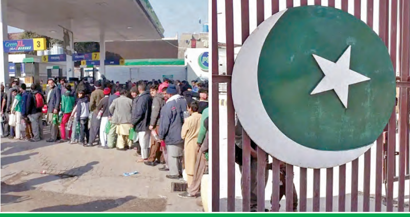
ఆకాశాన్నంటుతున్న ఇంధన, నిత్యావసరాల ధరలు పెట్టోల్ బంకుల వద్ద వాహనదారుల బారులు హార్ముజ్ జలసంధి మూసివేతతో మరిన్ని ఇక్కట్లు