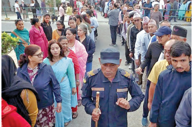
ఖాట్మండు, మార్చి 5: నేపాల్ పార్లమెంటు ఎన్నికలకు సంబంధించిన చెరువుమధ్య ఘటనలు మినహా దేశవ్యాప్తంగా పోలింగ్ ప్రశాంతంగా వినియోగించుకున్నారని పేర్కొంది. ప్రధానమంత్రి సుశీలా కార్కీ, నేపాల్ కాంగ్రెస్ అధ్యక్షురాలు