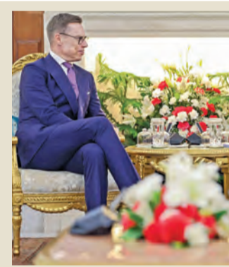
ప్రధాని మోడీ స్టేట్మెంట్ కరణ

ఫిన్లాండ్ అధ్యక్షుడు అలెగ్జాండర్ స్టేబ్ తో డ్విపాక్షిక చర్చలు వలసలు, మొబిలిటీపై భారత్, ఫిన్లాండ్ కీలక ఒప్పందం విద్యా రంగంలో పరస్పర సహకారానికి నిర్ణయం