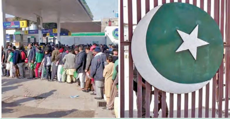
ఆకాశాన్నంటుతున్న ఇంధన, నిత్యావసరాల ధరలు పెట్టోరిల్ బంకుల వద్ద వాహనదారుల బారులు హార్నుజ్ జలసంధి మూసివేతతో మరిన్ని ఇక్కట్లు

కరాచీ, మార్చి 5: ఇరాన్ సర్వోన్నత నేత ఆయూల్లా అలీ ఖమేనీ హత్యతో పొరుగు దేశమైన పాకిస్తాన్లో తీవ్ర ఆందోళన, అశాంతి నెలకొంది. అమెరికా-ఇజ్రాయెల్ దాడుల్లో ఖమేనీ మరణం చందం పాకిస్తాన్పై, ముఖ్యంగా ఆర్థిక రంగంపై తీవ్ర ప్రతికూల ప్రభావం చూపుతుందని అం తర్వాతీయ మీడియాలో కథనాలు వెలువడ్డాయి. హోర్నుజ్ జలసంధి మూసివేస్తే ఇంధన ధరలు, విద్యుత్ ఛార్జీలు పెరిగిపోతాయని, ప్రజల జీవనం కష్టతరమవుతుందని పాకిస్తాన్ రీసెర్చ్ సెంటర్ డైరెక్టర్ ఖలీద్ తైముర్ అక్రమ్ తెలిపారు. పశ్చిమాసియాలో పనిచేస్తున్న పాకిస్తానియులు ఉద్యోగాలు కోల్పోయే ప్రమాదం ఉందని, తద్వారా దేశానికి వచ్చే రెమిటెన్స్లు తగ్గతాయని ఆందోళన వ్యక్తం చేశారు. ఈ సంఘటన ముది రితే ప్రపంచం మొత్తం నష్టపోతుందని నిపుణులు అభిప్రాయపడుతున్నారు.