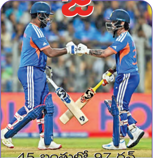
45 బంతుల్లో 97 రన్స్

ఈ డజలో జాకబ్ బెత్... విల్స్ జాక్స్(20 బంతుల్లో 35) ధాటిగా ఆడి భారత్ శిబిరంలో