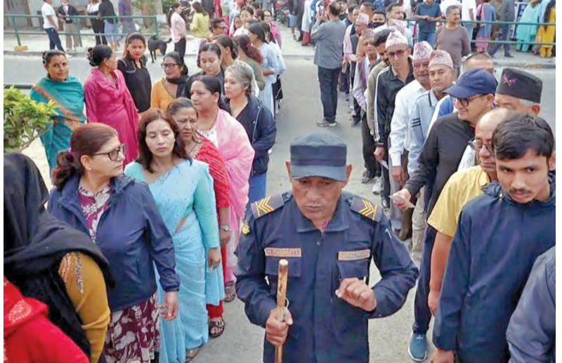
ఖాట్మండు, మార్చి 5: నేపాల్ పార్లమెంట్ ఎన్నికలకు సంబంధించిన చెదురుచదురు ఘటనలు మినహా దేశవ్యాప్తంగా పోలింగ్ ప్రశాంతంగా సాగింది. దీని ఆ దేశ ఎన్నికల సంఘం తెలిపింది. 915,119 మంది కోట్రగా నమోదైన