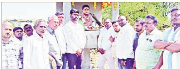
దుగ్గండి, మార్చి 5, ప్రభాతవార్త