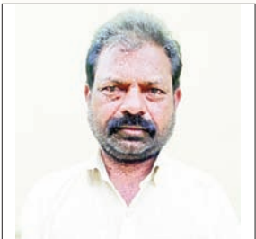
నల్లబెల్లి, మార్చి 5