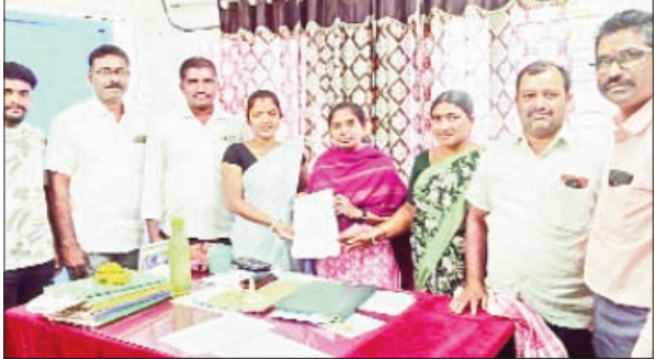
నల్లబెల్లి, మార్చి 5, ప్రభాతవార్త