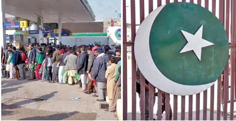
ఆకాశాన్నంటుతున్న ఇంధన, నిత్యావసరాల ధరలు పెట్రోల్ బంకుల వద్ద వాహనదారుల బారులు హార్సుక్ జలసంధి మూసివేతతో మరిన్ని ఇక్కట్లు