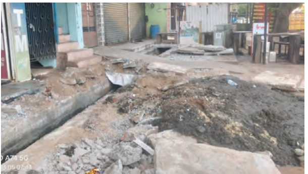
ఉండే అవకాశాలు మెండుగా ఉన్నాయని అంటున్నారు. కేవలం మున్సిపల్ అధికారులు మాత్రమే కాకుండా ఆర్.ఎం.డి.టి అధికారులు ఇందుకు సహకారస్తే సూక్ష్మరూపే పట్టణంలో గత కొంతకాలంగా నెలకొని ఉన్న ఆక్రమణలను సమస్యకు పరిష్కారం లభిస్తుంది.

సూక్ష్మరూపే, మార్చి 5 ప్రభాతవార: సూక్ష్మరూపే మున్సిపాలిటీలో ఆక్రమణలు తొలగించి గత కొన్నేళ్లూ ఆక్రమణల కింద పూడిపోయి ఉన్న డ్రైనేజీల్లో మురికితీత కార్యక్రమానికి మున్సిపల్ అధికార యంత్రాంగం శ్రీకారం చుట్టింది. ఇందులో భాగంగా పట్టణ సడీబోర్డులోని ఆర్.ఎం.డి.టి రోడ్డుకు తూర్పువైపు యంత్రాంగం ఉన్న ఆక్రమణలను తొలగించడంతో పాటు వాటి కింద ఉన్న మురికి కాలువల్లోని పూడిక తీసి కార్యక్రమాన్ని చేపట్టారు. గత ఎన్నో సంవత్సరాలుగా ఈ ఆక్రమణలు తొలగించు జరగకపోవడంతో చిన్నపాటి వర్షం వచ్చినా డ్రైనేజీలో నీరు కదలకపోవడంతో అటు ప్రజలకు ఇబ్బందులతో పాటు రోడ్డు కూడా ధ్వంసమయ్యే పరిస్థితి నెలకొంది. ఈ నేపథ్యంలో మున్సిపల్ అధికారులు ఎట్టకేలకు స్పందించారు. గత రెండురోజులుగా కాలువల్లో పూడిక తీత కార్యక్రమాన్ని కార్యకులు, జెసిబిల సహాయంతో ముమ్మరంగా చేపట్టారు. ఈ చర్యలపై పట్టణ ప్రజలు హర్షం వ్యక్తం చేస్తున్నారు. అలాగే రోడ్డుకు పడమర వైపు కూడా ఇవే విధంగా చర్యలు చేపట్టాలని కోరుతున్నారు. హోలీకాని జంక్షన్ నుంచి అయ్యప్ప గుడి వరకు ఉన్న రోడ్డుకు ఇరువైపులా డ్రైనేజిని క్రమంగా చేస్తూ ప్రస్తుతం సూతనంగా వేసిన బీబీ రోడ్డు దెబ్బతినకుండా మరింతకాలం ప్రజలకు అనువుగా