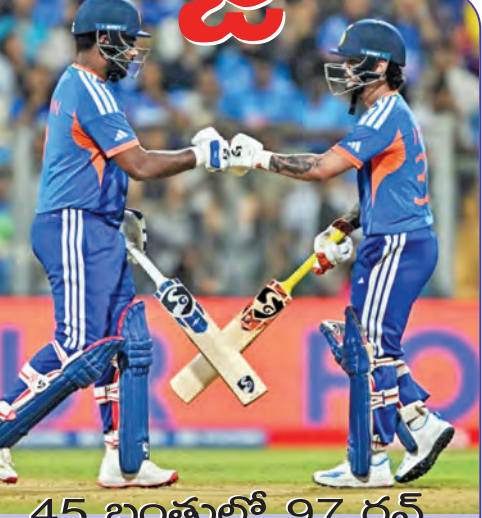
45 బంతుల్లో 97 రన్స్

ముంబై: రెండో సెమీఫైనల్లో మొదటి బ్యాటింగ్ చేసిన భారత్ నిర్ణీత 20 ఓవర్లలో 7 వికెట్లకు 253 రన్స్ చేసింది. ఓపెనర్ సంజూ శాంసన్(89)కు తోడు ఇషాన్ కిషన్ (18 బంతుల్లో 39), శిషు మూడో(25 బంతుల్లో 43), హార్డిక్ (12 బంతుల్లో 27), లిలక్ (7 బంతుల్లో 21) ధూమధామ్ బ్యాటింగ్ చేశారు. 254 పరుగుల లక్ష్యంతో బ్యాటింగ్ కు దిగిన ఇంగ్లాండ్ ను అరంభంలోనే సార్లీ(5)ను హార్డిక్, కెప్టెన్ బ్రూక్స్(7) బుట్టూ అవుట్ చేసి దెబ్బతీశారు. బుట్టూ(25)ను పరుట్ చేశారై, టామ్ బాటమ్(17)ను అక్షర్ పటేల్ బోల్గా కొట్టించారు. దీంతో 95 రన్స్ కే ఇంగ్లాండ్ 4 వికెట్ల కేల్లయింది. ఈ డశలో జాకబ్ బెటెల్... విల్స్ జాక్స్(20 బంతుల్లో 35) డాబ్బీగా ఆడి భారత్ శిబిరంలో