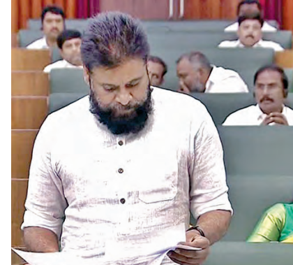
నాలుకున్నార తప్పిలే వాటి సంరక్షణకు చర్యలు తీసుకోవడం లేదని సభ్యులు నా దృష్టికి తీసుకోవాలి. వచ్చడం సంరక్షణకు సభ్యుల నిశిత దృష్టిని అభినందిస్తున్నాను. ఆదీ విధంగా ఇక మీదట అటువే శాఖ ఆధ్వర్యంలో పంపిణీ చేసేవాటికి, నాటి ప్రతి మొక్కకు జియో ట్యాగ్ వేసే ప్రక్రియ అమలు చేయాలని భావిస్తున్నాం. సర్కరీ డగ్గర నుంచే డీనిటీ ప్రత్యేక వ్యవస్థను అమలు చేసేలా ఒక ప్రత్యేక వ్యవస్థను తీసుకువస్తాం. బెంగళూరు సర్కరీలో అమలు చేస్తున్న ఆత్మాభివృద్ధి విధానాలను పరిశీలిస్తున్నాం.

విజయవాడ, మార్చి 5, ప్రభాతవార్త ప్రతినది: రాజ్ యే స్థానిక సంస్థల ఎన్నికల్లో భాగంగా జిల్లా ఎన్నికలను విభజించిన జిల్లా ప్రాతిపదికన నిర్వహించే యోచనలో ప్రభుత్వం ఉంది. ఇందుకు అనుగుణంగా కనరత్న జరుగుతోందని ఉప ముఖ్యమంత్రి వవన్ కళ్యాణ్ పేర్కొన్నారు. వందాయతల పునర్విభజనపై న్యాయపరమైన అడ్డంకులు ఏవీ లేవని చెప్పారు. గురువారం శాసనసభలో వవన్ మాట్లాడుతూ స్థానిక సంస్థల స్వావలంబనకు కూటమి ప్రభుత్వం కట్టుబడి ఉంది. అధికారంలోకి వచ్చిన వెంటనే స్థానిక సంస్థలను బలోపేతం చేసే చర్యలను తీసుకున్నాం. అలాగే రహదారుల విస్తరణ, ఇతర అభివృద్ధి కార్యక్రమాల కోసం చెట్లను తొలగించే పనులను ఆగ్నేయ ఎలాంటి ప్రత్యామ్నాయం తీసుకురావాలనే దానిపై పరిశీలన జరుపుతున్నాం. పర్యావరణ ప్రేమికుడిగా ఈ విషయంలో అన్ని వైపులా ఆలోచించి పచ్చదనాన్ని కాపాడేందుకు చర్యలు తీసుకుంటాం. కేవలం చర్యలు తీసుకోవడమే కాదు.. భవిష్యత్తులోనూ చెట్లను, పుష్పాలను సంరక్షించేలా బలమైన చట్టం తీసుకోవాలి అంటూ అలోచిస్తున్నాం. ఇది కఠినంగా అమలు చేస్తేనే పచ్చదనానికి భరోసా దొరుకుతుంది. అటువే శాఖ ఆధ్వర్యంలో మొక్కలను