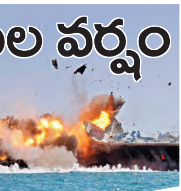
గురువారం ఇరాన్ దాడిలో దగ్గుమత్తులన్న అమెరికా ఇంధన ఓడ

బమన్ పోర్టుపై ఇరాన్ దాడి, ఇద్దరు భారతీయులు మృతి ఇజ్రాయెల్-యుఎస్ దాడుల్లో 1,230 మంది ఇరానియన్లు మృతి లెబనాన్ లో వంద మంది పైగా పౌరులు మృతి గ్రావిటీ బాంబులు ప్రయోగిస్తామని అమెరికా హెచ్చరికలు