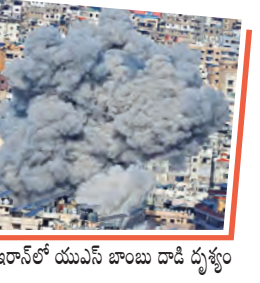
బాంబుల వర్షం కురిపిస్తోంది. పట్టణాలు, నగరాల్లో బాంబు దాడులతో దగ్ధరిల్లింది. ఎటువూసినా బాంబుపెలుక్క

లండన్, మార్చి 5: గతవారం నుంచి అమెరికా-ఇజ్రాయెల్, ఇరాన్ మధ్య యుద్ధంతో పశ్చిమాసియాలో అల్లకల్లోలం చెలరేగింది. సైనిక చర్యలు, పరస్పర హెచ్చరికలు, క్షిపణి దాడులతో ప్రాంతమంతా ఉద్రిక్తంగా మారింది. ఇరాన్ రాజధాని టెహ్రాన్ సహా దాదాపు 127 ప్రాంతాలను లక్ష్యంగా చేసుకుని ఇజ్రాయెల్-యుఎస్ వైమానిక దాడులు చేస్తూ, ఇరాన్ లో యుఎస్ బాంబు దాడి భృశం