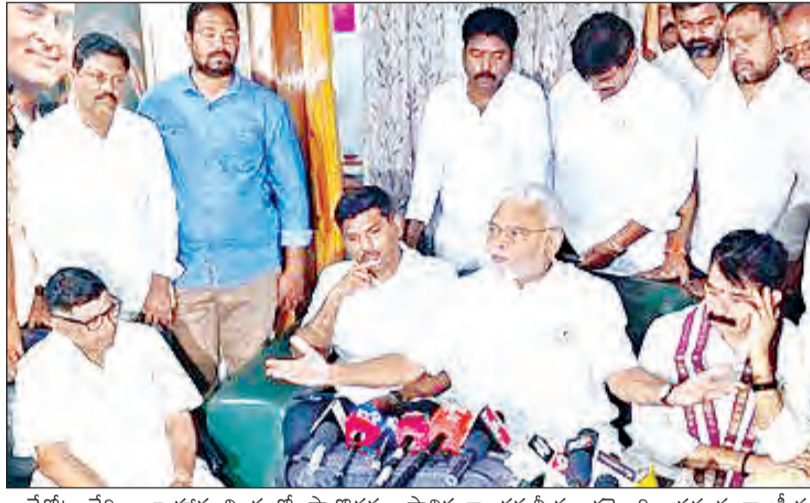
ఒకేటో చేరి అల్పాహార విందులో పాల్గొనడం స్థానికంగా చర్చనీయాంశమైంది. ప్రస్తుత రాజకీయ పరిస్థితులు, భవిష్యత్ కార్యచరణపై పీఠీ మధ్య లోకేశ్ చర్చ జరిగినట్లు తెలుస్తోంది. ఈ కార్యక్రమంలో పలువురు కాపు సంఘం నాయకులు, వైశాఖ కార్యకర్తలు పెద్ద సంఖ్యలో పాల్గొన్నారు.