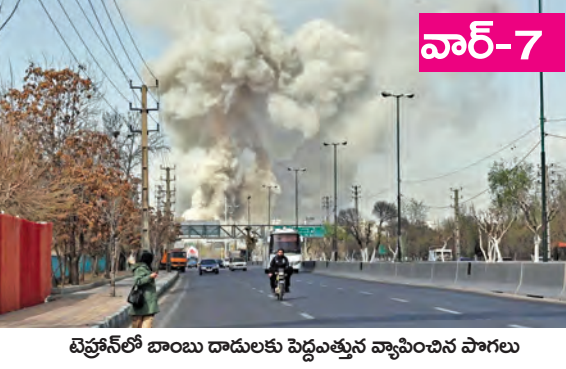
టెన్ లో బాంబు దాడులకు పుష్కల వ్యాపించిన పాగాలు

ఎలాంటి చర్యలు ఉండవు: ట్రంప్ విడవరోజున కూడా సాగిన భీకర పోరు గట్టిలోని చమురుశుద్ధి కేంద్రాలే ఇరాన్ బార్గెట్