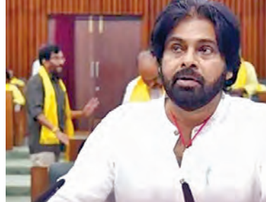
బడ్జెట్ లో చంద్రబాబు దూరదృష్టి, దక్షత, దాదానికత అడుగుదూరు ఉందని కొనియాడారు. వైసీపీ హయాంలో చేపట్టిన విద్యుత్ కొనుగోళ్ల కారణంగా డిస్కంలకు రూ.12,250 కోట్ల నష్టం వచ్చిందని చెప్పారన్నారు. కరెంట్ సరఫరాలో కూడా ఇబ్బందులు వచ్చాయని వివరించారు. రూ.1.29 లక్షల కోట్ల విద్యుత్ సంస్థలు నష్టపోయాయని, ఆ రూ.1.29 లక్షల కోట్లను సామాజిక మోక్షానికి వైశాఖ ప్రభుత్వం అధికారంలోకి >>2

రోడ్ల నిర్మాణానికి రూ.3,853 కోట్ల వ్యయం సామాజిక భద్రత పెన్నవకు రూ.33వేల కోట్లు బడ్జెట్ లో చంద్రబాబు దూరదృష్టి: డి.సిఎం పవన్