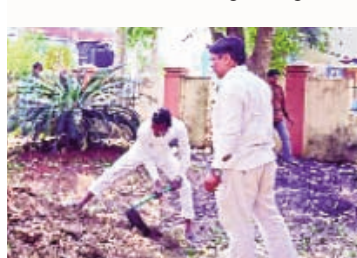
ఉపయోగపడని వస్తువులను కార్యాలయ లో పారిశుధ్య నిర్వహణ మరియు