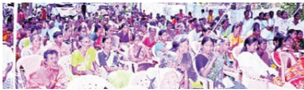
కార్యక్రమంలో పాల్గొన్న మహిళలు