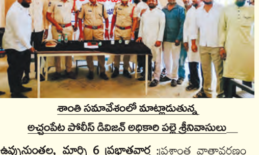
శాంతి సమావేశంలో మాట్లాడుతున్న అప్పంపేట పోలీస్ డ