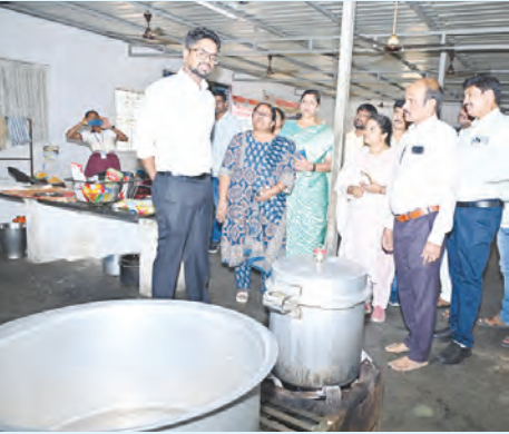
హస్తాల్లో వంటగదిని పరిశీలిస్తున్న జిల్లా కలెక్టర్

మొదటి పేజీ తరువాయి భాగం.. ఆదేశించారు. విద్యార్థులకు నాణ్యమైన ఆహారం అందించాలని సూచించారు. ఆహార విద్యార్థులకు వడ్డించే ముందు సూపర్వైజర్ తప్పనిసరిగా రుచి చూసిన తర్వాతనే అందించాలని ఆదేశించారు. అనంతరం ఆహార పదార్థాల నిల్వ గదిని పరిశీలించి, మేన్ కమిటీ పనిచేస్తున్నాడని ఆసి సిబ్బందిని ఆడిగి తెలుసుకున్నారు. స్టాక్ రిజిస్ట్రేషన్ పరిశీలించిన కలెక్టర్, పాఠశాలకు సరఫరా అయ్యే ఆహార పదార్థాలను దిగుమతి చేసినప్పుడు మేన్ కమిటీ విద్యార్థులు తప్పనిసరిగా సంతకం చేయాలని సూచించారు. ఈ సందర్భంగా జిల్లా వైద్య ఆరోగ్య శాఖ అధ్యక్షులతో పాఠశాలలో నిర్వహిస్తున్న వైద్య శిబిరాన్ని కలెక్టర్ పరిశీలించారు. విద్యార్థుల ఆరోగ్య నివేదికలను పరిశీలించి, ఆరోగ్యం పై సూచనలు చేశారు. తర్వాత వరో తరగతి విద్యార్థుల గదిని సందర్శించి విద్యార్థులకు కలెక్టర్ మాట్లాడారు. రాబోయే బోర్డు పరీక్షల సేవల్లో అందరూ కృషిచే చదివి మంచి ఫలితాలు సాధించాలని సూచించారు. ప్రభుత్వ రెసిడెన్షియల్ పాఠశాలలో స్టాఫ్ కోసం చాలా పోటీ డిమాండ్ ఉంటుందని, మీకు లభించిన ఈ అవకాశాన్ని సద్వినియోగం చేసుకోవాలని విద్యార్థులకు తెలిపారు. ఈ సందర్భంగా పైభాగం సిద్ధాంతాన్ని సులభమైన పద్ధతుల్లో అర్థం చేసుకోవాలి విద్యార్థులకు వివరించారు. అనంతరం విద్యార్థులను ప్రశ్నలు ఆడిగి, సరైన సమాధానాలు చెప్పిన వారికి నోటీసులు అందజేసి ప్రోత్సహించారు. డిఎంసావే. డా. సాయిరాజ్ రెడ్డి, ప్రోగ్రాం అధికారి డా. పరిమళ, తహసీల్దార్ వెంకటేశ్వర్లు, మున్సిపల్ కమిషనర్, ఎంకేఓ, పాఠశాల సిబ్బంది తదితరులు పాల్గొన్నారు.