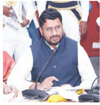
మాట్లాడుతున్న కలెక్టర్ రిజాన్ బాషా షేక్

గద్వాల మార్చి 6, ప్రభాతవార్త : జోగు లాంటి గద్వాల జిల్లాలో ప్రజా పాలన, ప్రగతి ప్రణాళిక కార్యక్రమాన్ని విజయవంతం చేసేందుకు సమాధానమైతే జిల్లా కలెక్టర్ రిజాన్ బాషా షేక్ తెలిపారు. జిల్లా, మండల స్థాయిలో కార్యక్రమాన్ని విజయ వంతం చేసేందుకు ఇప్పటికే సంబంధిత శాఖల అధికారులతో సమన్వయ సమావేశాలు నిర్వహించామన్నారు. కార్యక్రమంలో భాగంగా మొదటి రోజు అన్ని ప్రభుత్వ కార్యాలయాల్లో పరిశుభ్రత కార్యక్రమాలు నిర్వహిస్తున్నామన్నారు. గ్రామ పంచాయతీ స్థాయి నుంచి జిల్లా స్థాయి వరకు వేపట్టాలను ఆయా కార్యక్రమాలను షెడ్యూల్ ప్రకారం నిర్వహించేందుకు సమగ్ర ప్రణాళిక రూపొందించామన్నారు. ప్రభుత్వం ఈ రెండేళ్లలో అమలు చేసిన వివిధ సంక్షేమ పథకాలు, వివిధ అభివృద్ధి కార్యక్రమాలను ప్రజల్లోకి తీసుకెళ్లేందుకు కృషి చేస్తున్నట్లు తెలిపారు. ఆయా ధీమ్ లకు సంబంధించి నోడల్ అధికారులను నియమించడం జరిగిందన్నారు. ఈ కార్యక్రమంలో భాగంగా వేపట్ల పనుల ఫోటోలు, ఇదివరకటి పరిశీలి ఫోటోలు నోటీసు చేయడం జరుగుతుందన్నారు. ఆయా శాఖల వారీగా వచ్చిన దరఖాస్తులకు సంబంధించి ఎప్పటికప్పుడు సంబంధిత శాఖల అధికారులు పరిష్కరించాలని ఆదేశాలు జారీ చేశామన్నారు. ప్రభుత్వం