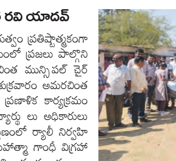
ప్రజా పాలన ప్రగతి ప్రణాళిక కార్యక్రమము