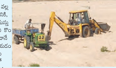
జైలతో ఇసుకను తరలింపు చేస్తున్న ధృక్పథం

మొదటి పేజీ తరువాయి భాగం.. ప్రాంతాలకు ఇసుక తరలింపు చేయడం వల్ల భూగర్భ జలాలు అదగంతే వ్యవసాయానికి, త్రాగునీటికి ఇబ్బందులు వస్తాయని గ్రామస్థులు ఆవేదన వ్యక్తం చేశారు. గ్రామంలోని కొందరు గ్రామపంచాయతీ తీర్మానం లేకుండానే ఇతర ప్రాంతాలకు ఇసుక తరలింపు చేయడం సరికాదని వెంటనే ఇసుకను తరలింపును ఆపివేయాలని గ్రామస్థులు ముక్కరంకోత వ్యతిరేకించారు. దీంతో ఇరు వర్గాల మధ్య కొద్దిపాటి వాదనలు కొనసాగాయి. ప్రస్తుతం వేసవికాలం కావడంతో ఇసుక తరలింపులో రాబోయే రోజుల్లో మంచినీటి కష్టాలు తరలించేటటువంటి గ్రామస్థులు గుర్తు చేశారు. మా గ్రామం నుంచి ఇసుక తరలింపును ఆపివేయాలని మండల తహసీల్దార్ ఎల్లన్నకు గ్రామస్థులు వినతి పత్రం అందజేశారు.