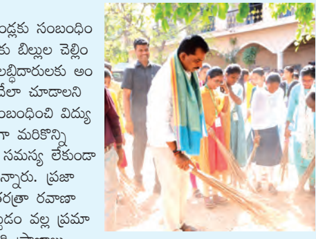
తమదానం చేస్తున్న ఎమ్మెల్యే మోగా రెడ్డి

మొదటి పేజీ తరువాయి భాగం.. చర్యలు తీసుకోవాలన్నారు. ఇందిరమ్మ ఇండ్లకు సంబంధించి బెన్సోట్ల నిర్మించుకున్న లద్దాచూరు బిల్లు వెల్లింపులో పూర్తిస్థాయి అవగాహన లేదని లద్దాచూరు అందుకు సంబంధించిన అవగాహన కల్పించేలా చూడాలని ఆయన సూచించారు. వ్యవసాయానికి సంబంధించి విద్యుత్ సరఫరాలో కొన్ని ప్రాంతాల్లో ఒకలాగా మరికొన్ని ప్రాంతాల్లో ఇంకోలా ఉందని ఆలాటి సమస్య లేకుండా సంబంధిత అధికారులు పరిష్కరించాలన్నారు. ప్రజా రవాణాకు సంబంధించి ఆటోలలో ఇతరత్రా రవాణా వాహనాలలో ఎక్కువమందిని కార్టోబెడ్లకు వల్ల ప్రమాదాలు జరిగిన సమయంలో ఎక్కువమంది ప్రజలకు కోల్పోతున్నారని ఆర్టీఓ అధికారులు దృష్టి సారించి ప్రమాదాలు నివారణ పై చర్యలు తీసుకోవాలన్నారు. ముఖ్యమంత్రి సొంత జిల్లాలో అభివృద్ధి పనులపై అధికారులు ప్రత్యేక దృష్టి సారించాలని ఆయన సూచించారు.