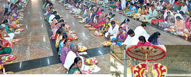
కాణిపాకం, మార్చి 6 ప్రభాతవార్త: కాణిపాకం శ్రీవరసద్ది వినాయకస్వామి దేవస్థానంలో శుక్రవారం సంకటహర గణపతివ్రతంను అత్యంత వైభవంగా నిర్వహించారు. ఆలయంలో ప్రతిరోజూ పాఠశాల అసంతరం చతుర్థి రోజున ఈవ్రతంను నిర్వహిస్తుంటారు. ఈమేరకు దేవస్థానం ఆస్థాన మండలంలో శుక్రవారం చతుర్థి వ్రతం ఉదయం, సాయంత్రం వేళల్లో మూడు దఫాలుగా అర్చకులు నిర్వహించారు. ఈమేరకు ఉదయం 9, 11 గంటలకు, సాయంత్రం 5 గంటలకు ప్రతాన్ని మూడు దఫాలుగా నిర్వహించారు. ఈసందర్భంగా ఉదయం ప్రధాన అలయం నుండి అంతరించిన సిద్ది బుద్ది సమేత గణనాథుని ఉత్సవమూర్తులను మంగళవాయిద్యాల సదుపాయం సాగించి అస్థాన మండలంకు తీసుకువచ్చి పులి ప్రత్యేకపూజలు నిర్వహించారు. ఆనంతరం వేదపండితుల మంత్రోచ్ఛారణ సదుపాయం అర్చకులు ప్రతాన్ని శాస్త్రోక్తంగా నిర్వహించారు. ఈసందర్భంగా అలయ వేదపండితులు సంకష్ట చతుర్థి వ్రతం మహాత్మాన్ని గురించి వివరించారు. ఈవ్రతంను ఆచరించడం వల్ల భక్తులకు కాఠిభాదలు, కష్టాలు తొలగి అనుకున్న కోరికలు నెరవేరి అంతా శుభం కలుగుతుందని పురాణాలు స్పష్టం చేస్తున్నాయని వేదపండితులు పేర్కొన్నారు. ఈకార్యక్రమంలో అలయ ఈ. పెంచల కిషోర్ ఏకట రవీంద్రబాబు, సూరపరెండెంటు కోదండరాజు, వాసు, అలయ అర్చకులు వేదపండితులు, వెంకటేశ్ ఇన్స్ పెక్టర్లు బాలాజినాయుడు, రవి, వివిధ ప్రాంతాల నుండి వచ్చిన భక్తులు పాల్గొన్నారు.