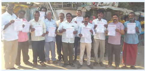
సదస్సు కరపత్రాలను విడుదల చేశారు. ఈ సందర్భంగా ఆయన మాట్లాడుతూ ప్రైవేటు రంగంలో రిజర్వేషన్ల సామాజిక న్యాయం వెనుకబడిన వర్గాలకు ఉపాధి కల్పన కోసం కూటమి ప్రభుత్వం సంపూర్ణంగా సహకరించడం