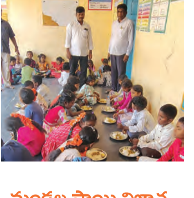
మండల స్థాయి విజ్ఞాన వారోత్సవాలు