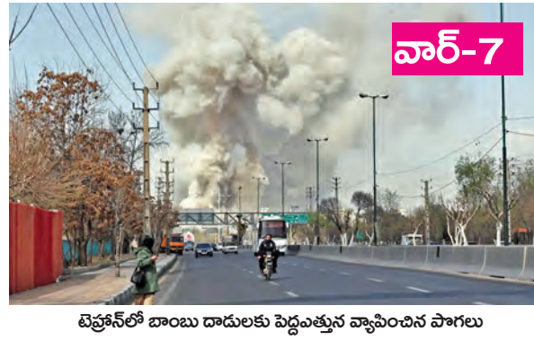
టెక్సెస్/జెనుసెం/వాషింగ్టన్, మార్చి 6: మధ్యప్రాచ్యదేశాల్లో ప్రస్తున్న యుద్ధం మరింత తీవ్రం అవుతోంది. అటు ఇరాన్, ఇటు అమెరికా, ఇజ్రాయెల్ లు భీకర దాడులుచేస్తున్నాయి. మరోపక్క అమెరికా స్థావరాల లక్ష్యాగా ఇరాన్ దాడులు కొనసాగుస్తూనే ఉంది. ఈ క్రమంలో ఎలాంటి చర్యలు ఉండవని, బేషరతుగా ఇరాన్ లొంగిపోవాల్సిందేనంటూ ట్రంప్ హెచ్చరికలు చేశాడని సంవేశాలు విడుదలచేశారు. తన సొంత సోషల్ మీడియా ట్విట్లో గంటకోకొత్త సంవేశం వస్తోంది. అలాగే ఇరాన్ సైతం యుద్ధం కొనసాగుతున్నప్పటికీ కొన్ని దేశాలు దౌత్యపరంగా చర్యలకు ప్రయత్నిస్తున్నాయని, త్వరలో కొంతమేర తగ్గవచ్చని ఇరాన్ అధ్యక్షుడు పెజ్కెషియాని ప్రకటించారు. అయితే ఇమేమీ ఉండవని ఇరాన్ లో ఎవరున్నా తన ప్రయోగం తప్పనిసరి అని ట్రంప్ చెప్పతూ కొత్తగా ఎన్నికైన సుప్రీం కమాండర్ ముజ్తబా ఖమైని లాము అంగీకరించబోమని, నియంత వార సులను అంగీకరించేదేదని ట్రంప్ విప్లవం చేశారు. ఇరాన్

ఎలాంటి చర్యలు ఉండవు: ట్రంప్ ఏడవరోజున కూడా సాగిన భీకర పోరు గట్టిలోని చమురుశుద్ధి కేంద్రాల్లో ఇరాన్ టార్గెట్