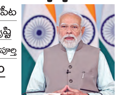
అభివృద్ధి ప్రయాణంలో వ్యవసాయం ఒక ప్రాధాన్యత మూలస్థంభమని ఆయన నొక్కి చెప్పారు. అలాగే నేషనల్ మిషన్ ఆన్ ఎడిటల్ అయిల్స్, పప్పుధాన్యాల సాగు ద్వారా వ్యవసాయ రంగాన్ని బలోపేతం చేస్తున్నట్లు వెల్లడించారు. వ్యవసాయ రంగంపై దృష్టి పెట్టేలా రాష్ట్రాలను ప్రోత్సహించాలని కోరారు. భారత సుదీర్ఘ