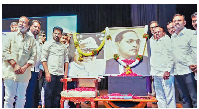
శుభ్రపారం హైదరాబాద్ మాదిగ ఉద్యోగుల సమన్వయ కమిటీ సమావేశంలో పాల్గొన్న సిఎం రేవంత్ రెడ్డి, మంత్రి దామోదర, పలువురు ఉద్యోగ సంఘ నాయకులు

ప్రభాతవార్త ప్రధాన ప్రతినిధి హైదరాబాద్, మార్చి 6: విత్తశుద్ధితో ప్రజాసమన్వయ పరిష్కారస్థానంగా, ప్రజాపాలనలో ప్రజలంతా సంఘోషగా ఉన్నారని ముఖ్యమంత్రి ఎ. రేవంత్ రెడ్డి తెలిపారు. శుభ్రపారం హైదరాబాద్ శిల్పకళావేదికలో మాదిగ ఎంపైలుని కోఆర్డినేషన్ కమిటీ అధ్యక్షుర్యంలో శిల్పకళా వేదికలో సిఎం సన్మాన కార్యక్రమం నిర్వహించారు. ఈ సందర్భంగా రేవంత్ రెడ్డి మాట్లాడుతూ ఇప్పుడున్నది మీరంతా కోరుకున్న ప్రభుత్వమని తెలిపారు. ఇది మీరంతా కష్టపడి తెచ్చుకున్న ప్రభుత్వమని పేర్కొన్నారు. ఎన్నికల్లో మీరంతా తమకు అండగా నిలబడ్డారని గుర్తు చేశారు. మార్చి కోసమే 2023 ఎన్నికల్లో ప్రజా ప్రభుత్వాన్ని తెచ్చుకున్నారని వివరించారు. చిత్రశుద్ధితో ప్రజల ముందుకు వచ్చాం కాబట్టి ప్రజా ప్రభుత్వం ఏర్పడింది. తమది పేదల పక్షపాత ప్రభుత్వమని సీఎం రేవంత్ రెడ్డి అభివృద్ధించారు. గత పాఠకులు ఎన్నో అక్రమాలు చేశారు సీఎం రేవంత్ విమర్శించారు. గత ఎన్నికల్లో తాము మాటలు, మూటలతో గెలవలేదని, కేవలం ప్రజల మద్దతుతోనే తాము అధికారంలోకి వచ్చామని చెప్పారు. తమ వద్ద ఎలాంటి అక్రమ సంపాదన లేదన్నారు. వర్గీకరణ కోసం మాదిగ జాతి ఎంతో పోరాడింది ఈ సందర్భంగా సీఎం రేవంత్ గుర్తు చేశారు. ఈ పోరాటంలో ఆనేక మంది ప్రాణాలు కోల్పోయారని ఆయన ఆవేదన వ్యక్తం చేశారు. 20 ఏళ్ల నుంచి వర్గీకరణ సమస్య ఉందన్నారు. మీ న్యాయమైన హక్కు కోసం మొనరించి నుంచి మద్దతుగా ఉన్నారని తెలిపారు. వర్గీకరణ కోసం ఆసెంట్లలో తీర్మానం తీర్మానం తీర్మానం తీర్మానం వివరించారు. మిత్తుడి కోసం కోసం ఊపిరి వరకు కర్షణ నిలబడ్డాడని చెప్పారు. మహాభారతంలో కర్షణ, బాధ్యురకుడి మాదిగ