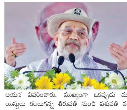
ఆయన వివరించారు. ముఖ్యంగా ఒక్కప్పుడు మావోయిస్టులు కలలుగన్న తిరుపతి నుంచి పశుపతి వరకు

భువనేశ్వర్, మార్చి 6: దేశంలో వామపక్ష తీవ్రవాదాన్ని పూర్తిగా తుడిచి పెట్టేస్తామని కేంద్ర హోం మంత్రి అమిత్ షా మరోసారి స్పష్టం చేశారు. ఓడిశాలోని కటకలో జరిగిన కేంద్ర పారిశ్రామిక భద్రతా దళం 57వ రైజింగ్ డే వేడుకల్లో ఆయన ముఖ్య అతిథిగా పాల్గొన్నారు. ఈ సందర్భంగా మాట్లాడుతూ, ఈ మార్చి నెలఖర నాటికి భారతదేశం మావోయిజం నుంచి పూర్తి విముక్తి పొందుతుందని ధీమా వ్యక్తం చేశారు. గతంలోనే నిర్ణయించుకున్న లక్ష్యం ప్రకారం, దేశాన్ని నక్సలైజం రహితంగా మార్చి ప్రత్యేక తుది దశకు చేరుకుందని