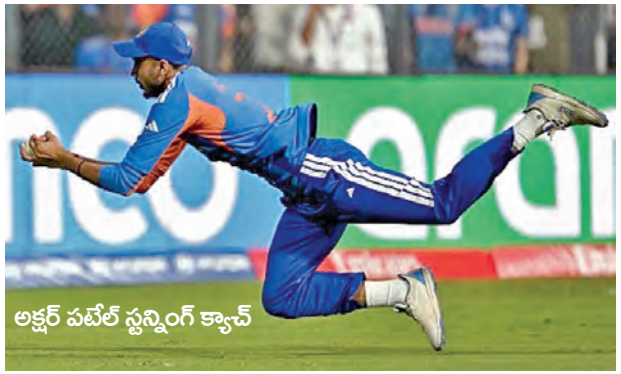
అక్టోబర్ ఫీట్ ఫ్లయింగ్ క్యాపెన్

ముంబై: క్యాపెన్ విన్ మ్యాచెస్ ఏమో గానీ క్యాపెన్ డ్రాప్ అయితే మ్యాచ్ గోవిందే. ఇదే వాంఖడేలో జరిగిన సెకెండ్ సెమీఫైనల్ గెలిచిన టీమిన్ డి.ఎం.డి.యా. ఓడిన ఇంగ్లాండ్ మధ్య తేడా. అసాధ్యమైన క్యాపెన్లను సుసాధ్యం చేయడం తోనే టీమిన్ డి.ఎం.డి.యా గెలవగలిగింది. సులువైన క్యాపెన్లను కూడా అందుకోలేక ఇంగ్లాండ్ ఇంటిముఖం పట్టింది. ఇంగ్లాండ్ కెప్టెన్ క్యాపెన్లు కాదు వదిలేసింది కపెన్లు అని సోషల్ మీడియాలో తెగ వైరల్ అవుతోంది.