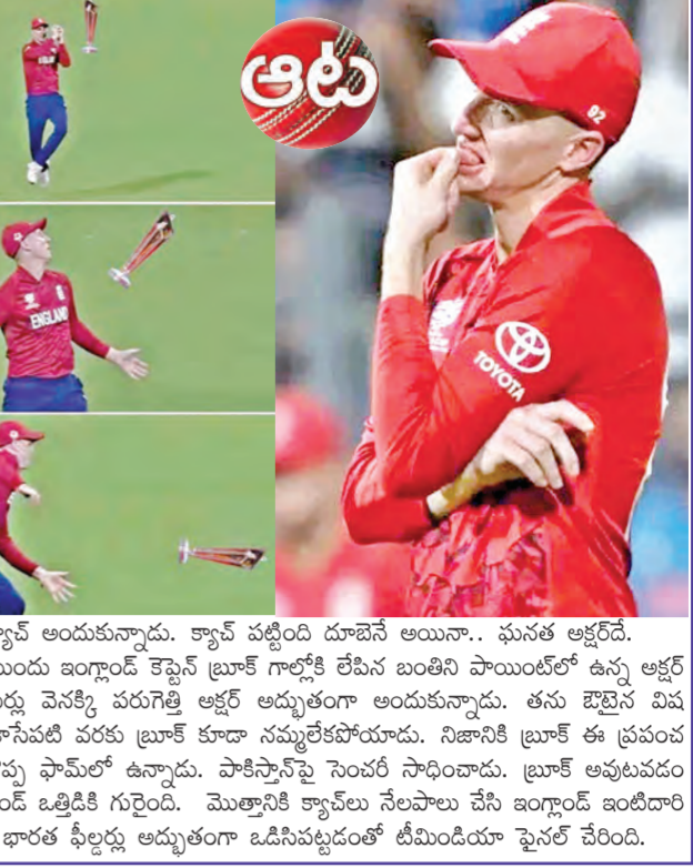
అతను క్యాచ్ అందుకున్నాడు. క్యాచ్ పట్టించి దూబి అయినా.. ఘనత అక్షరదే. అంతకుముందు ఇంగ్లాండ్ కెప్టెన్ బ్రూక్ గాల్ఫోర్డీ లేపిన బంతిని పాయింట్లో ఉన్న అక్షర 28 మీటర్లు వెనక్కి పరుగెత్తి అక్షర అడ్డుతంగా అందుకున్నాడు. తన బౌలెస్ విషయాన్ని కాపాడే పరుగుకై బ్రూక్ కూడా నమ్మలేకపోయాడు. నికాని బ్రూక్ ఈ ప్రపంచ కప్ లో గొప్ప ఫామ్ లో ఉన్నాడు. పాకిస్తాన్ సెంచుర్ల సాధించాడు. బ్రూక్ అప్పలపడం తో ఇంగ్లాండ్ ఒత్తిడి గురైంది. మొత్తానికి క్యాచ్ నేలపాలు చేసి ఇంగ్లాండ్ అందిదారి పడితే... భారత ఫీల్డర్లు అడ్డుతంగా ఒడిపట్టడంతో టీమిండియా ఫైనల్ చేరింది.

క్యాప్ డ్రాప్... మ్యాచ్ డ్రాప్... ఇది ఇంగ్లాండ్ కు వాంఛదేలో భాగం తెలిసాల్సింది. కెప్టెన్ బ్రూక్ లాల్పావోలా వచ్చిన క్యాచ్ నేలపాలు చేయడంతో ఇంగ్లాండ్ భారీ మూల్యం చెల్లించు కుంది. అప్పటికే అభిషేక శర్మ అప్పలయ్యాడు. నంజా శాంఘ్ 15 పరు గుల వద్ద ఉన్నాడు. ఇన్నింగ్స్ మూడో ఓవర్లో అర్జున్ టెండల్ వాన్ నంజా మీదానలో ఇచ్చిన సులువైన క్యాచ్ ను కూడా బ్రూక్ అందుకోలేకపోయాడు. దీంతో లైవ్ లైన్ పొందిన నంజా ఆదనంగా 74 రన్స్ చేశాడు. అంతేకాదు ఇషాన్ కిషన్ తో విలువైన భాగస్వామ్యం నడిపాడు. ఒకవేళ బ్రూక్ క్యాచ్ అందుకుని ఉంటే టీమిండియా మరింత అత్తిడిలో పడేది. ఆ క్యాచ్ కాదు సెమి ఫైనల్లో ఇంగ్లాండ్ ఫీల్డింగ్ దారుణంగా ఉంది. పలు క్యాచ్ లు చేశారాయి. భారత ఇన్నింగ్స్లో నంజా క్యాచ్ చేశారంటే కీలక మలుపుతే... ఇంగ్లాండ్ ఇన్నింగ్స్ లో వీల్ జాక్సన్ క్యాచ్ ఇంకా గొప్ప టర్నింగ్ పాయింట్. బెటెల్తో కలిసి విలువైన భాగస్వామ్యంతో మ్యాచ్ ను ఇంగ్లాండ్ వైపు తిప్పాడు జాక్సన్. ఈ భాగస్వామ్యం ఇంకొంతనూ కొనసాగితే మ్యాచ్ హోమే. కానీ అల్విన్ వేసిన 14వ ఓవర్లో ఫుల్టాసాగా వచ్చిన బివెరింగ్తో జాక్సన్ కప్పల్లో భారీ పాల్ ఆడాడు. చాలాదూరం నుంచి పరుగెత్తుకుని వచ్చిన అక్షర.. అప్పటికే రిటిర్ అయి అందుకున్నాడు. కానీ ఆ పరుగులో తనను తాను నియంత్రించు కోలేకపోయిన అక్షర.. మరుగు స్పందించి తన ముందే ఉన్న దూబి వైపు బంతి విసరగా