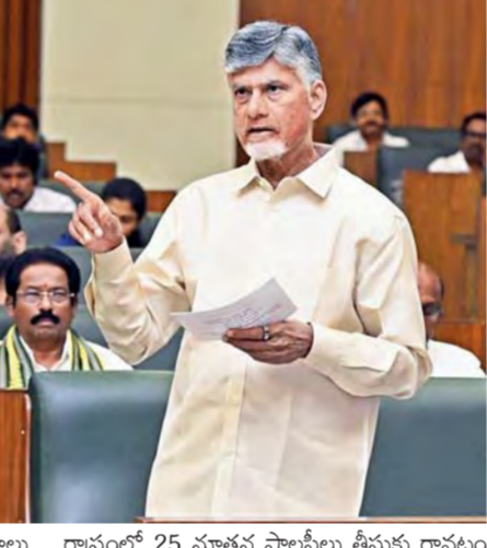
రాష్ట్రంలో 25 నూతన పాలసీలు తీసుకు రావడం ద్వారా రూ.20 లక్షల కోట్ల పెట్టుబడులు సాధించాం. వీటితో 23 లక్షల మందికి ఉద్యోగాలు కూడా వచ్చే అవకాశం ఉంది. పర్యాటక రంగానికి పారిశుధ్యం హోదా ఇచ్చి ప్రోత్సహిస్తున్నాం. సర్దుబాటు ఎకానమీతో వ్యర్థాల ద్వారా సంపద సృష్టిస్తున్నాం. ఇటీవలే వివాదాల పరిష్కారం చేసాం. మద్యం పరిశ్రమపై డ్యూటీ పెంచాలని సూచనలు వచ్చాయి.

విజయవాడ, మార్చి 6: ప్రభాతవార్త ప్రతినిధి: ప్రజలకు మెరుగైన జీవన ప్రమాణాలు ఇవ్వాలనే పది సూత్రాలతో 2047 స్వర్ణాంధ్ర విజన్ రూపకల్పన చేశామని. ఆర్థిక అసమానతలు తగ్గించేలా ప్రభుత్వం నిరంతరం పనిచేస్తోంది. త్వరలోనే ప్రతి కుటుంబానికి ఫ్యామిలీ బెనిఫిట్ మేనేజ్మెంట్ సిస్టం కార్యక్రమం కూడా జారీ చేస్తామని. శాసనసభలో ప్రవృత్తి వినియోగం బిల్లుపై ముఖ్యమంత్రి చంద్రబాబు ప్రసంగించారు. గత పాఠకుల అసెంబ్లీ విధానాల కారణంగా సంక్షోభంలో పడిన రాష్ట్రాన్ని సంక్షేమం, అభివృద్ధి వైపు నడిపిస్తున్నామని ఆయన అన్నారు. వివిధ అంశాలపై ముఖ్యమంత్రి మాట్లాడుతూ గత పాఠకుల అసెంబ్లీ వ్యవస్థల ద్వారా సమయం గడచిన 20 నెలల్లో కష్టాలు, సమస్యల్ని అధిగమించి రాష్ట్రాన్ని గాడిలో పెట్టాం. విద్యం సంఘం విశాసం వైపు, సంక్షోభం నుంచి సంక్షేమం వైపుగా రాష్ట్రాన్ని నడిపిస్తున్నాం. ఆర్థిక ఇబ్బందులు ఉన్నా సూపర్ సిక్స్ ను సూపర్ హిట్ చేశాం. 15 కోట్ల పాటు జరిగిన శాసనసభలో ఐదు కోట్ల మంది ప్రజలకు భవిష్యత్తు గురించి చర్చలు జరిగాయి. భావికాలం విషయాలపై నిర్ణయించేలా ఈ సమావేశాల్లో చర్చలు, నిర్ణయాలు జరిగాయి. విభజన వల్ల, గత పాఠకుల విద్యం సంఘం వల్ల సమస్యలు రాష్ట్రాన్ని పునరుద్ధిస్తున్నాం. డిప్యూటీ సీఎం పవన్ కల్యాణ్, రాష్ట్రంలో 25 నూతన పాలసీలు తీసుకు రావడం ద్వారా రూ.20 లక్షల కోట్ల పెట్టుబడులు సాధించాం. వీటితో 23 లక్షల మందికి ఉద్యోగాలు కూడా వచ్చే అవకాశం ఉంది. పర్యాటక రంగానికి పారిశుధ్యం హోదా ఇచ్చి ప్రోత్సహిస్తున్నాం. సర్దుబాటు ఎకానమీతో వ్యర్థాల ద్వారా సంపద సృష్టిస్తున్నాం. ఇటీవలే వివాదాల పరిష్కారం చేసాం. మద్యం పరిశ్రమపై డ్యూటీ పెంచాలని సూచనలు వచ్చాయి.