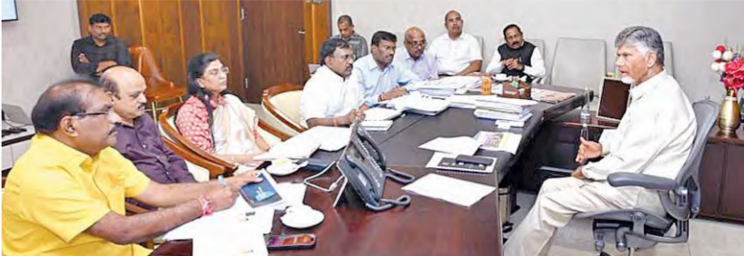
పునరావాస పనులు కంప్లీట్ కావాలి. పునరావాసం విషయంలో ఏమైనా ఇబ్బందులు ఎదురైతే... వెంటనే పరిష్కరించుకోవాలి. దీనికి అవసరమైన నిధులు, పరిపాలనా అనుమతుల విషయంలో జాప్యం చేయవద్దు. పునరావాసం విషయంలో నిర్మాణానికి అవసరమైన నిధులను అందజేస్తామని ఆర్.కె.ఎం. అర్ అండ్ అర్ పనులు చేపట్టేలా కార్యక్రమం తీసుకోవాలి అని ముఖ్యమంత్రి ఆదేశించారు.

● ప్రాజెక్టుల నిర్మాణ నాణ్యతలో రాజీ లేదు ● ప్రాధాన్యతల వారీగా ఇరిగేషన్ ప్రాజెక్టులు చేపట్టాలి ● ప్రాజెక్టులకు ఇవ్వాలైన నిధులపై ఆర్థిక శాఖ రూట్ మ్యాప్ సిద్ధం చేసుకోవాలి ● ప్రాజెక్టుల నిర్మాణాలు సుదీర్ఘ కాలం ఎన్నికల హామీలుగా మిగలకూడదు ● ఇరిగేషన్ శాఖ సమీక్షలో ముఖ్యమంత్రి చంద్రబాబు