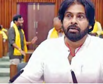
బడ్జెట్ లో చంద్రబాబు దూరదృష్టి, దక్షత, దారుణతకే అపగడునా ఉందని కోనియాడారు. వైసీపీ హయాంలో చేపట్టిన విద్యుత్ కోసం కోట్ల కోట్ల ఖర్చు చేస్తున్నామని వివరించారు. 12.250 కోట్ల నష్టం వచ్చిందని చెప్పిపోయారు. కరోనా సరఫరాలో కూడా ఇబ్బందులు వచ్చాయని వివరించారు. రూ.1.29 లక్షల కోట్లు విద్యుత్ సంస్థలు నష్ట భావితాల కోసం అన్న రివీల్ మెంట్ తర్వాత సూక్ష్మలను పవన్ కల్యాణ్ ప్రస్తావించారు. కూటమి ప్రభుత్వం అధికారంలోకి వచ్చిన తర్వాత కూడా ఇలాంటి పథకాలు జరగడం దురుదృష్టం. ప్రజలకు సమాచారం అందడం ద్వారా కూడా ఉపయోగం ఉంటుంది. రాష్ట్ర వ్యాప్తంగా గోకూలు నిర్మాణంతో పాటు గ్రామీణ ప్రాంతాల్లో రూ.4998 కోట్ల మొత్తం పనులు చేపట్టాలని ప్రకటించారు. పల్లె పండుగ, ఆడవి తల్లి బాట పేరు గ్రామీణ, గిరిజన ప్రాంతాల్లో రూ.4998 కోట్ల మొత్తం పనులు చేపట్టాలని ప్రకటించారు.