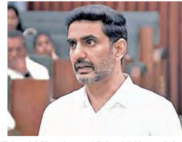
రాష్ట్రంలో 7వ తరగతి నుంచి 12వ తరగతి బాలికలకు ఉచితంగా శానిటరీ న్యాప్ కిన్ లను పంపిణీ చేయడం జరుగుతుందని విద్య, ఇటీ శాఖల మంత్రి నారా లోకేశ్ పేర్కొన్నారు. ప్రభుత్వ ప్రైవేటు విద్యాలయాలలోని విద్యార్థినులకు ఉచితంగా శానిటరీ న్యాప్ కిన్ లను అందజేసేందుకు శాసనసభలో సభ్యులు కావలి గ్రీన్ లైట్ ఇచ్చిన ప్రకృతి మంత్రి లోకేశ్ సమాధానం ఇస్తూ ప్రభుత్వ విద్యాలయాలలో 7వ తరగతి నుంచి వచ్చే తరగతి వరకు చదువుతున్న బాలికలకు ఉచితంగా శానిటరీ న్యాప్ కిన్ లను సరఫరా చేయడం జరుగుతుంది. గతంలో ఏడు రెన్యూలర్ సైట్, మూడు లాక్స్ సైట్ న్యాప్ కిన్లు ఇచ్చారు. ఫీడ్ బ్యాక్ తీసుకున్న తర్వాత 5 రెన్యూలర్ సైట్, 5 లాక్స్ సైట్ శానిటరీ న్యాప్ కిన్ల ప్రభుత్వం అందజేస్తోంది. గత ప్రభుత్వంలో 18.96 కోట్ల బకాయిలు పెట్టారు. ప్రజా ప్రభుత్వం ఆ బకాయిలను తీర్చడం జరిగింది. ఆర్డీఎస్ నుంచి

హెచ్ఎపి విద్యార్థినిపై అవగాహన కలిగిస్తూ తల్లికివందనం కింద 67 లక్షల మందికి సాయం: మంత్రి లోకేశ్ విజయవాడ, మార్చి 6: ప్రభాతవార్త ప్రతినిధి: రాష్ట్రంలో 7వ తరగతి నుంచి 12వ తరగతి బాలికలకు ఉచితంగా శానిటరీ న్యాప్ కిన్ లను పంపిణీ చేయడం జరుగుతుందని విద్య, ఇటీ శాఖల మంత్రి నారా లోకేశ్ పేర్కొన్నారు. ప్రభుత్వ ప్రైవేటు విద్యాలయాలలోని విద్యార్థినులకు ఉచితంగా శానిటరీ న్యాప్ కిన్ లను అందజేసేందుకు శాసనసభలో సభ్యులు కావలి గ్రీన్ లైట్ ఇచ్చిన ప్రకృతి మంత్రి లోకేశ్ సమాధానం ఇస్తూ ప్రభుత్వ విద్యాలయాలలో 7వ తరగతి నుంచి వచ్చే తరగతి వరకు చదువుతున్న బాలికలకు ఉచితంగా శానిటరీ న్యాప్ కిన్ లను సరఫరా చేయడం జరుగుతుంది. గతంలో ఏడు రెన్యూలర్ సైట్, మూడు లాక్స్ సైట్ న్యాప్ కిన్లు ఇచ్చారు. ఫీడ్ బ్యాక్ తీసుకున్న తర్వాత 5 రెన్యూలర్ సైట్, 5 లాక్స్ సైట్ శానిటరీ న్యాప్ కిన్ల ప్రభుత్వం అందజేస్తోంది. గత ప్రభుత్వంలో 18.96 కోట్ల బకాయిలు పెట్టారు. ప్రజా ప్రభుత్వం ఆ బకాయిలను తీర్చడం జరిగింది. ఆర్డీఎస్ నుంచి