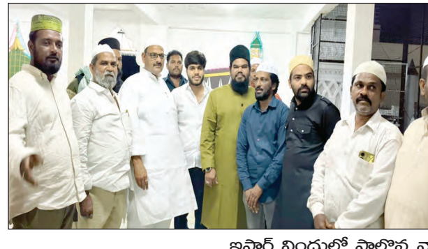
ఇష్టార్ విందులో పాల్గొన్న నాయకులు, ముస్లిం నాయకులు