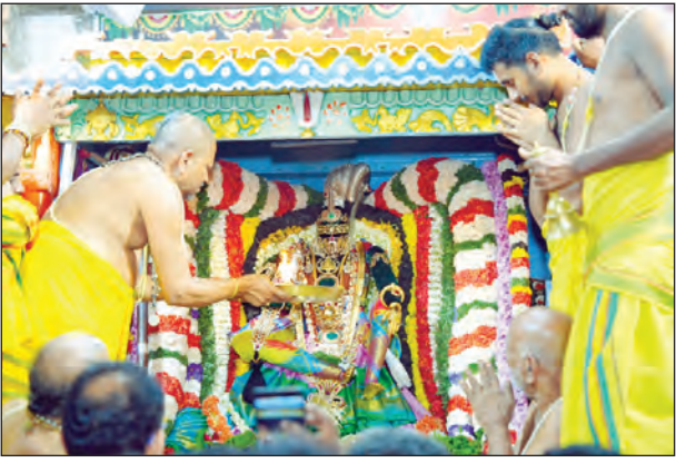
మోహినీ అవతారంలో దర్శనం ఇస్తున్న శ్రీవారు

ప్రముఖ ప్రసిద్ధి గాంచిన శ్రీమతీఖాద్రి లక్ష్మీనరసింహస్వామి బ్రహ్మోత్సవాల్లో భాగంగా శనివారం స్వామివారు మోహినీ రూపంలో భక్తులకు దర్శనం ఇచ్చారు. మైమరపించే సోయగాలు, అమృత బాండాగారం ధరించి మోహినీ రూపుడైన శ్రీవారినీ దర్శించుకోవడానికి వేలాది మంది భక్తులు తరలివచ్చారు. దీంతో ఆలయ ప్రాంగణంకోపాలు తిరవిధులు నండడిగా మారాయి. ఉదయం యాగశాలలో నిత్య పూజల అనంతరం