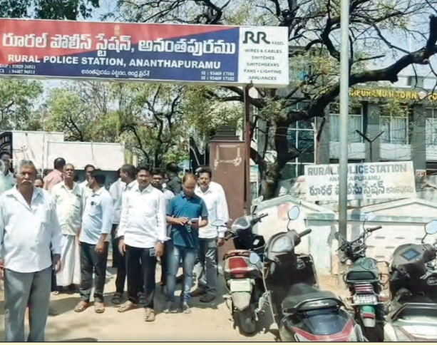
అనంతపురం రూరల్ పోలీస్ స్టేషన్ దగ్గర బిల్డింగులతో బాధిత షాట్ల యజమానులు ఆవేదన వెల్లడించుకుంటున్న దృశ్యాలు