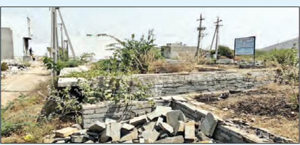
ప్రభుత్వ లేబర్లో అనంపూర్ నిర్మాణాలు