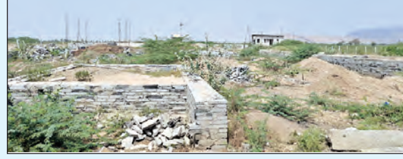
గృహనిర్మాణానికి మంజూరు చేయకపోయినా చేపట్టిన నిర్మాణాలు

యాడికి(తాడిపత్రి), మార్చి 7, ప్రభాతవార్త నిరుపేదలకు సొంతిల్లు కల్పించాలనే ప్రభుత్వ లక్ష్యం. అందులో భాగంగా యాడికి మండల కేంద్రంలో నివసిస్తున్న 564 మంది నిరుపేదలకు ప్రయోజనం చేకూర్చేలా 14.42 ఎకరాల్లో ఇంటి స్థలాలను కేటాయించారు. పేదలందరికీ ఇళ్ల అనే సంకల్పంతో ప్రధాన మంత్రి ఆవాసి యోజన పథకం కింద 2022-23 వరకు 319 మందికి మాత్రమే ఇళ్ల మంజూరు చేశారు. అప్పట్లో గృహాలు లేనివారి నుంచి దరఖాస్తులు స్వీకరించి, వాటి ఆధారంగా గ్రామాల్లో వివరాలు చేసి అధికారులను ఎంపిక చేశారు. ఆర్థికపరిమితి ఇళ్ల అందించాలనే లక్ష్యంతో ప్రభుత్వం గృహనిర్మాణ పథకాన్ని ప్రవేశ పెట్టినా దశాబ్దాల జోక్యంతో అనంపూరు అందరిం ఎక్కించారు. అప్పటికే గ్రామంలో సొంతిల్లును అనంపూరు అధిక శాతం ఇంటి స్థలాలు కట్టబెట్టడంతో కొందరు నిర్మాణాలపై ఆసక్తి చూపకపోగా, ఇంకొందరు స్థలాలను అనంపూరుకొకగా అమ్మేసుకోగా, మరి కొందరు ఇల్లు మంజూరయ్యే వరకు వేచిచూసి ఆ తర్వాత మొత్తం ఇతరుల అమ్మేసుకోవడంలో ఆర్థులకు అనాయం జరుగుతోంది. ఇంకా రెట్టింపు సంఖ్యలో ఇంటి స్థలాలు కోసం దరఖాస్తులు కార్యాలయాలకు వస్తుండటంతో ఆర్థులతో.. అనంపూరుతో అనే సందర్భ పరిస్థితి నెలకొంది.