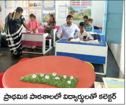
ప్రాథమిక పాఠశాలలో విద్యార్థులతో కలెక్టర్

నెలల్లో బస్సు ఏర్పాటు చేస్తామని, బిటి రోడ్డు మంజూరు చేస్తామని గ్రామస్థులకు హామీ ఇచ్చారు. ఈ పర్యటనలో భాగంగా రేకులకుంట్ల గ్రామంలో ఆంగన్వాడీ కేంద్రంను, ప్రైవేట్ స్కూల్, మండల పరిషత్ ప్రాథమిక పాఠశాలను జిల్లా కలెక్టర్ తనిఖీ చేశారు. ఈ సందర్భంగా ఆంగన్వాడీ