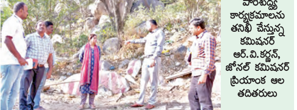
పారిశుధ్య కార్యక్రమాలను తనిఖీ చేస్తున్న కమిషనర్ ఆర్.వి.కర్ణ, జివెచ్ఎస్ కమిషనర్ ప్రయోగం ఆల తదితరులు

హైదరాబాద్, మార్చి 7, ప్రభాతవార్త: 99 రోజుల ప్రజా పాలన - ప్రగతి ప్రణాళిక కార్యక్రమంలో గ్రేటర్ హైదరాబాద్ నగరంలో పారిశుధ్యం మరింత మెరుగు పడాలని దిశగా అధికారులు, పారిశుధ్య కార్యకర్తల కలిసి ఒక్కొక్క పనిచేయాలని జివెచ్ఎస్ కమిషనర్ ఆర్.వి. కర్ణ దిశా నిర్దేశం చేశారు. రాష్ట్ర ప్రభుత్వం అమలు చేస్తున్న 99 రోజుల ప్రజా పాలన - ప్రగతి ప్రణాళిక కార్యక్రమం నెపథ్యంలో హైదరాబాద్ జివెచ్ఎస్ జూబ్లీహిల్స్ సర్కిల్ వరదిల్లో జివెచ్ఎస్ కమిషనర్ ప్రయోగం అలతో కలిసి పారిశుధ్య పనులను ఆకస్మికంగా తనిఖీలు చేశారు. మొదట బంజారాహిల్స్ లోని ఎన్.బీ.టి. నగర్, ఆపాలో ఆసుపత్రి సమీపంలోని గార్డెస్ వల్లూరులో పాయింట్ వద్ద జరుగుతున్న కార్యకలాపాలను క్షేత్రస్థాయిలో పరిశీలించారు. ఈ రెండు ప్రాంతాల్లో ఉన్న జీవీపిలు పూర్తిగా తొలగించాలని, పారిశుధ్యాన్ని మరింత మెరుగు పరచాలని సంబంధిత అధికారులకు ఆదేశాలు జారీ చేశారు. తదనంతరం బంజారాహిల్స్ ఎమ్మెల్యే కాలనీలో ఉన్న ఖాళీ స్థలాన్ని పరిశీలించి ఆ ప్రదేశంలో ప్రజలకు ఉపయోగపడేలా పార్కింగు అభివృద్ధి చేయాలన్నారు.