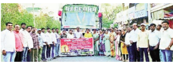
హైదరాబాద్ వెళ్తున్న ఉపాధ్యాయులు