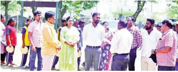
ఉపాధ్యాయులతో మాట్లాడుతున్న కలెక్టర్