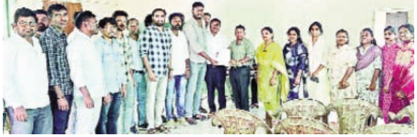
వినతిపత్రం అందజేస్తున్న దృశ్యం

రాష్ట్రంలోని వ్యవసాయ రంగ అభివృద్ధిలో కీలక పాత్ర పోషిస్తున్న ఏకావోలపై పని భారం తగ్గించాలని జిల్లా ఏకావోలు కోరారు. ఫర్టిలైజర్ బుకింగ్ యాప్, పీఎం కిసాన్, రైతు భీమా, ప్రకృతి వ్యవసాయం, రైతు విశిష్ట కార్డు వంటి పథకాలను విజయవంతంగా అమలు చేస్తూ, రాష్ట్రాన్ని ఆగ్రస్థానంలో నిలిపేందుకు తాము నిరంతరం శ్రమిస్తున్నామని వారు పేర్కొన్నారు. ఇప్పటికే అనేక బాధ్యతలతో సతమతమవుతున్న తమపై, అదనంగా డిజిటల్ పంటల సర్వే వెరిఫికేషన్ వంటి పనుల భారం మోపడం సరికాదని వారు ఆవేదన వ్యక్తం చేశారు. ఈ మేరకు బ్రాహ్మణపల్లి రైతు వేదికలో జిల్లా వ్యవసాయ అధికారిని శనివారం కలిసి ఏకావోలు వినతి పత్రం సమర్పించారు. డిజిటల్ పంటల సర్వే వెరిఫికేషన్ పనుల నుంచి తమకు మినహాయింపు ఇవ్వాలని కోరారు. రైతులకు మరింత నాణ్యమైన, మెరుగైన సేవలు అందించాలంటే ఏకావోల పని ఒత్తిడిని తగ్గించడం తప్పనిసరి అని వారు స్పష్టం చేశారు.