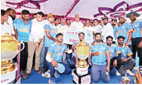
బహుమతి శ్రీహరి స్పోర్ట్స్, నాలుగో బహుమతి