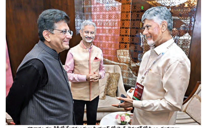
శనివారం న్యూఢిల్లీలో కేంద్రమంత్రులు పియూష్ గోయల్, జైశంకర్ తో సీఎం చంద్రబాబు