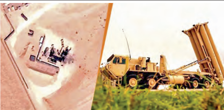
ఇరాన్ దాడిలో ద్వంసమైన అమెరికా రక్షణ రాడార్ వ్యవస్థ

సంస్కరణల వల్లే దేశం అభివృద్ధి.. త్వరలో లివర్డ్ మైగ్రేషన్ తద్దం ప్రపంచంలో ఎక్కడచూసినా భారతీయులే ప్రమాద నివారణకే కొత్త జనాభా విధానం రైసినా డైలాగ్-2026 సందర్భంలో సీఎం చంద్రబాబు