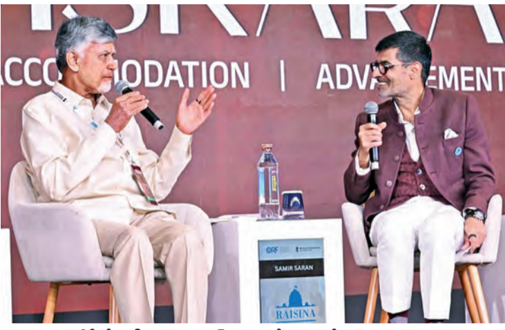
శనివారం న్యూఢిల్లీలో జరిగిన రైసినా డైలాగ్-2026లో సందర్శించి మాట్లాడుతున్న సీఎం చంద్రబాబు

విజయవాడ, మార్చి 7, ప్రభాతవార్త ప్రతినది: సంస్కరణల వల్లే మన దేశం అభివృద్ధి చెందుతుందని, ప్రపంచంలో ఎక్కడికీ వెళ్లినా భారతీయులు కనిపిస్తారని ఏపీ ముఖ్యమంత్రి చంద్రబాబు అన్నారు. ఢిల్లీలో భారత విదేశీ వ్యవహారాల మంత్రిత్వశాఖ అభ్యర్థన రీసెర్చ్ ఫౌండేషన్ ఆధ్వర్యంలో నిర్వహించిన రైసినా డైలాగ్ -2026 సందర్భంలో ఆయన పాల్గొన్నారు. సాంకేతికత, సుపరిపాలన భవిష్యత్తు అంశాలపై చంద్రబాబు కీలక ఉపన్యాసం చేశారు. ఈ క్రమంలో ఆయన మాట్లాడుతూ అనేక విషయాల్లో కేంద్రంతో కలిసి ముందుకెళ్తున్నట్లు తెలిపారు. భవిష్యత్తులో గ్లోబల్ కమ్యూనిటీకి సేవ చేసే సామర్థ్యం భారతకే ఉంది అన్నారు. ప్రపంచ దేశాలకు విస్తృత సేవలు అందిస్తున్న వారితో భారతీయులే ఎక్కువగా ఉన్నారు. ప్రపంచంలో ఎక్కడైనా భారతీయులే అత్యుత్తమ డిప్లొమాట్స్. ఎక్కడికీ వెళ్లినా స్థానికులతో కలిసిమెలిసి నివసించటంలో వారికి మించిన వారులేరు. ప్రత్యేకించి బహిష్కార వివిధ రంగాల్లో గ్లోబల్ కమ్యూనిటీకి, ప్రపంచ సంక్షేమానికి భారతీయులు సేవలు అందిస్తున్నారు. గతంలో భారతీయ నిపుణులు సిలికాన్ వ్యాలీ లాంటి చోట్ల మేధావులు జరిగింది. కానీ త్వరలో రివర్స్ మైగ్రేషన్ అంటే మొదలవుతుంది నిపుణులు, వనరులు ఉన్న చోట్లకే అవకాశాలు