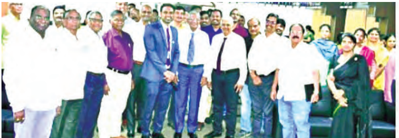
విశాఖపట్నం, మార్చి 7 ప్రభాతవార్త

విలువైన సూచనలు అందించిన సీనియర్ చార్టర్డ్ అకౌంటెంట్లు