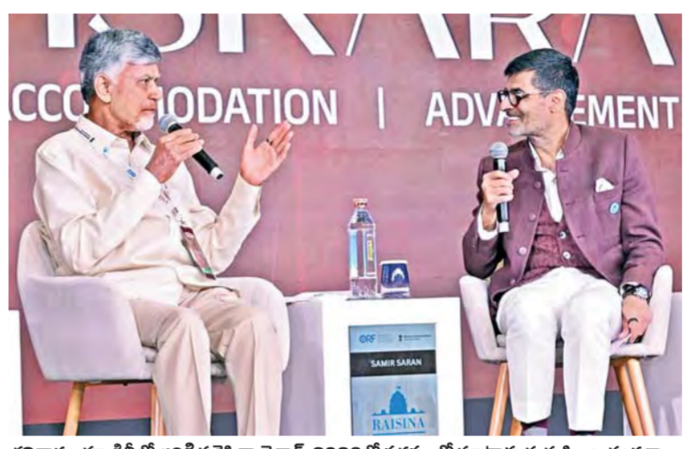
శనివారం న్యూఢిల్లీలో జరిగిన రైసినా డైలాగ్-2026లో సదస్సులో మాట్లాడుతున్న సీఎం చంద్రబాబు

విజయవాడ, మార్చి 7 ప్రభాతవార్త ప్రతినిధి: సంస్కరణల వల్లే మన దేశం అభివృద్ధి చెందుతుందని, ప్రపంచంలో ఎక్కడికీ వెళ్లినా భారతీయులు కనిపిస్తారని ఏపీ ముఖ్యమంత్రి చంద్రబాబు అన్నారు. ఢిల్లీలో భారత్ విదేశీ వ్యవహారాల మంత్రిత్వ శాఖ ఆధ్వర్యంలో రీసెర్చ్ ఫౌండేషన్ ఆధ్వర్యంలో నిర్వహించిన రైసినా డైలాగ్ -2026 సదస్సులో ఆయన పాల్గొన్నారు. సాంకేతికత, సుపరిపాలన భవిష్యత్తు అంశాలపై చంద్రబాబు కీలక ఉపన్యాసం చేశారు. ఈ క్రమంలో ఆయన మాట్లాడుతూ అనేక విషయాలలో కేంద్రంతో కలిసి ముందుకెళ్తున్నట్లు తెలిపారు. భవిష్యత్తులో గ్లోబల్ కమ్యూనిటీకి సేవ చేసే సామర్థ్యం భారత్ కి ఉందని సీఎం అన్నారు. ప్రపంచ దేశాలకు విస్తృత సేవలు అందిస్తున్న వారిలో భారతీయులే ఎక్కువగా ఉన్నారని ప్రపంచంలో ఎక్కడైనా భారతీయులే అత్యుత్తమ డిప్లొమాట్స్. ఎక్కడికీ వెళ్లినా స్థానికులతో కలిసిమెలిసి నివసించటంలో వారికి మిందైన వారులేరు. ప్రత్యేకించి ఐటీ సహా వివిధ రంగాల్లో గ్లోబల్ కమ్యూనిటీకి, ప్రపంచ సమాజానికి భారతీయులు సేవలు అందిస్తున్నారు. గతంలో భారతీయ నిపుణులు సిలికాన్ వ్యాలీ లాంటి చోట్లకు మేధో వలస జరిగింది. కానీ త్వరలో రివర్స్ మైగ్రేషన్ అంటే మొదలుపెట్టుతుంది నిపుణులు, వనరులు ఉన్న చోట్లకే అవకాశాలు