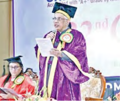
అబ్దుల్ నజీర్ పేర్కొన్నారు. ప్రపంచం వేగంగా మారుతున్న నేపథ్యంలో విద్యార్థులు కృత్రిమ మేధస్సు(ఏఐ), క్వాంటమ్ టెక్నాలజీ, రోబోటిక్స్, నానో టెక్నాలజీ, ఇంటెల్జెంట్ ఆఫ్ థింగ్స్, పునరుత్పాదక శక్తి వంటి ఆధునిక రంగాల్లో నైపుణ్యాలు పెంపొందించుకోవాలని సూచించారు. రాష్ట్ర ప్రభుత్వం డిజిటల్ గవర్నెన్స్, నైపుణ్యాభివృద్ధి, సాంకేతిక రంగాల్లో కీలక చర్యలు చేపడుతున్నదని, ఇందులో భాగంగా రాష్ట్రంలో క్వాంటమ్ వ్యాల్టీ ఏర్పాటు చేయడం ద్వారా ఆధునిక పరిశోధనకు >>2

కాకుండా జ్ఞానం, పట్టుదల ఆశయాలు విజయోత్సవమని పేర్కొన్నారు. విద్యార్థులు తరగతి గదుల్లో నేర్చుకున్న జ్ఞానాన్ని సమాజ అభివృద్ధికి వినియోగించే దశకు ఇది మార్పుగా గవర్నర్ సూచించారు. విద్య మనిషికి కేవలం ఉద్యోగ అవకాశాలకే కాకుండా బాధ్యత, మార్గదర్శనం, లక్ష్య నిర్దేశం కూడా ఇస్తుందని తెలిపారు. పదుపుకు మహిళలు కేవలం తమ కుటుంబాల అభివృద్ధికి కాకుండా దేశ ఆర్థిక ప్రగతికి, సామాజిక స్థిరత్వానికి కూడా ప్రధాన కారణ మవుతారని పేర్కొన్నారు. పద్మావతి మహిళా విశ్వవిద్యాలయంలో జరుగుతున్న పరిశోధనలు ఇప్పటికే అనేక జాతీయ సంస్థలకు ఉపయోగపడుతున్నాయని అభినందించారు. విశ్వవిద్యాలయం విద్య, పరిశోధన రంగాల్లో మంచి పురోగతి సాధిస్తోందని గవర్నర్ జస్టిస్