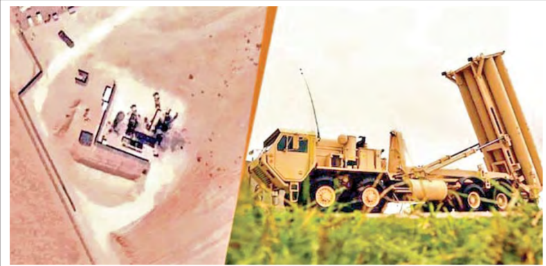
ఇరాన్ దాడిలో ధ్వంసమైన అమెరికా రక్షణ రాడార్ వ్యవస్థ

Published from Visakhapatnam, Vijayawada, Hyderabad, Rajahmundry, Guntur, Nizamabad, Ongole, Warangal, Tirupathi, Kadapa, Kurnool, Anantapur, Karimnagar, Mahabubnagar, Khammam, Nellore, Nalgonda, Tadepalligudem, Srikakulam 8-3-2026 ఆదివారం సంపుటి: 32 సంః: 36 పేజీలు: 16 వెల: 8.00