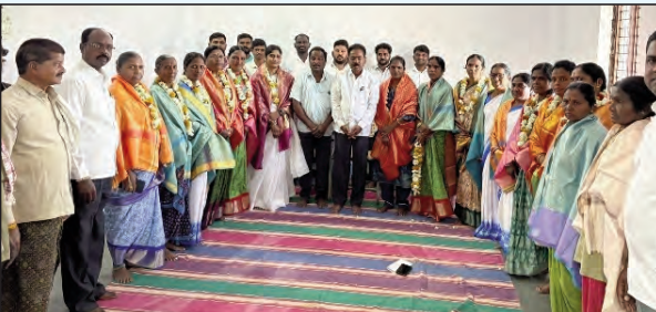
మహిళలను సన్మానిస్తున్న సర్పంచ్, గ్రామ పెద్దలు