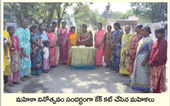
మహిళా దినోత్సవం సందర్భంగా కేక్ కట్ చేసిన మహిళలు