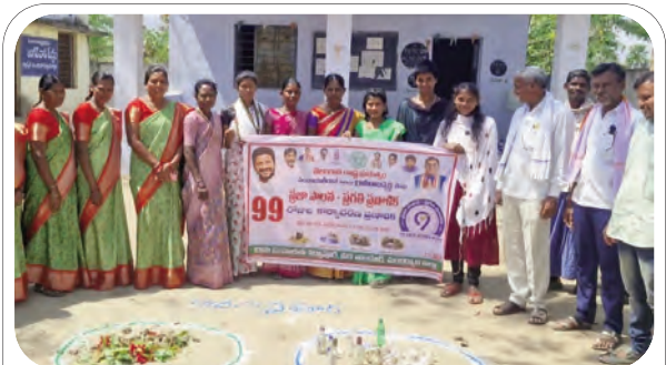
బెల్ట్ షాపులు పెట్టకూడదని తీర్మానించిన మహిళలు