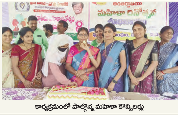
కార్యక్రమంలో పాల్గొన్న మహిళా కౌన్సిలర్లు