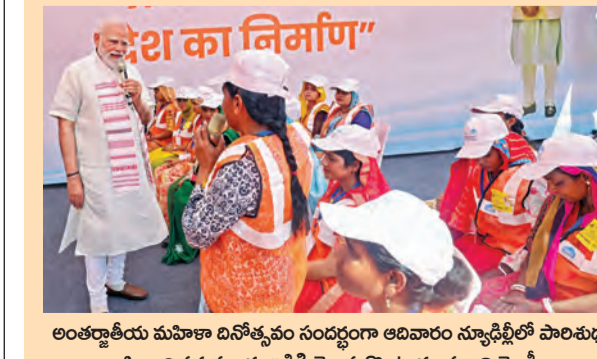
అంతర్జాతీయ మహిళా దినోత్సవం సందర్భంగా అదివారం న్యూఢిల్లీలో పాలిట్రామిక సజ్జంది సమస్యలను అడిగి తెలుసుకొంటున్న ప్రధాని మోడీ

మహిళలు బాస్లుగా ఉన్న కుటుంబంలో పెరిగా: రావల్ >>2