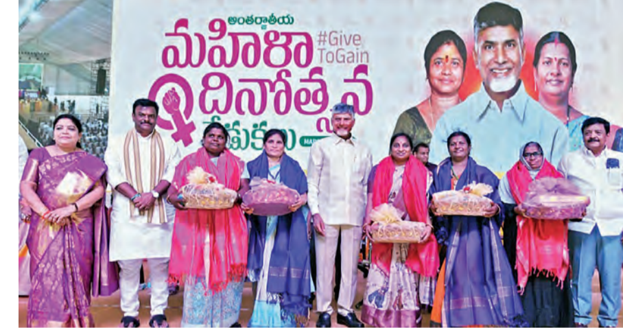
అదివారం మహిళా దినోత్సవం సందర్భంగా ఇదుగురు మహిళా పాలిట్రామిక వేత్తలను సత్కరించిన సిఎం చంద్రబాబు

పలు హోటళ్లపై బిల్లుల ఎగవేత ఆరోపణలు పలువురిపై కేసులు నమోదు విజయవాడ, మార్చి 8, ప్రభాతవార్ ప్రతినిధి: రాష్ట్రవ్యాప్తంగా పలు ప్రాంతాల్లో రెస్టారెంట్లపై ఐటీ అధికారులు దాడులు నిర్వహిస్తున్నారు. రాజమండ్రి, నెల్లూరు, విశాఖ పట్నం, విజయవాడ, గుంటూరు, శ్రీకాకుళం ప్రాంతాల్లోని పలు రెస్టారెంట్లలో ఐటీ సోదాలు చేపట్టారు. ట్యాక్స్ కట్టకుండా బిల్లులు ఎగ్గొడుతున్నారని ఈ రెస్టారెంట్లపై హోటళ్ల యాజమాన్యాలపై ఆరోపణలు వచ్చాయి. ఈ నేపథ్యంలో అదివారం ఆ కేసులకు ఐటీ దాడులు జరిగాయి. ఈ క్రమంలో కంప్యూటర్ డేటాను ఐటీ అధికారులు పరిశీలిస్తున్నారు. ప్రధానంగా ఆన్లైన్ పేమెంట్స్, డిజిటల్ డేటాను పరిశీలిస్తున్నారు. ఇటీవల రూ.70వేల కోట్ల అమ్మకాల డిజిటల్ రికార్డులను పలు హోటళ్లు, రెస్టారెంట్ల యజమానులు తీలగించారని సమాచారం. ఈ క్రమంలో కీలక ఆధారాలని ఆధారం అవుతున్నా అధికారులు >>2