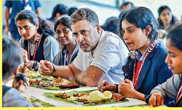
అదివారం కేరళలో విద్యార్థులను కలిసి భోజనం చేస్తున్న రావల్ గాంధీ