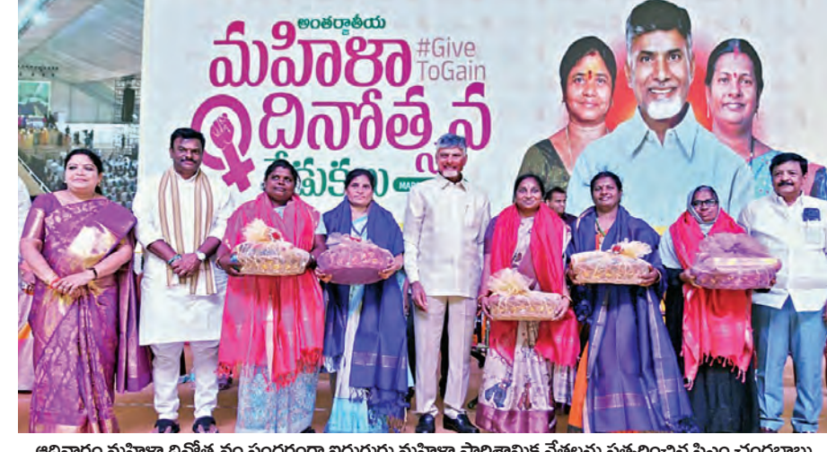
అదివారం మహిళా దినోత్సవం సందర్భంగా విడుగురు మహిళా పాలిట్రామిక వేత్తలను సత్కరించిన సిఎం చంద్రబాబు

విజయవాడ, మార్చి 8, ప్రభాతవార్త ప్రతినిధి: రాష్ట్రవ్యాప్తంగా పలు ప్రాంతాల్లో రెస్టారెంట్లపై ఐటీ అధికారులు దాడులు నిర్వహిస్తున్నారు. రాజమండ్రి, నెల్లూరు, విశాఖ పట్టణం, విజయవాడ, గుంటూరు, శ్రీకాకుళం ప్రాంతాల్లోని పలు రెస్టారెంట్లలో ఐటీ సోదాలు చేపట్టారు. ట్యాక్స్ కట్టకుండా బిల్లులు ఎగ్గొడుతున్నారని ఈ రెస్టారెంట్ల, హోటళ్ల యాజమాన్యాలపై ఆరోపణలు వచ్చాయి. ఈ నేపథ్యంలో అధికారం ఆకస్మిక ఐటీ దాడులు జరిగాయి. ఈ క్రమంలో కంప్యూటర్ డేటాను ఐటీ అధికారులు పరిశీలిస్తున్నారు. ప్రధానంగా ఆన్లైన్ పేమెంట్స్, డిజిటల్ డేటాను పరిశీలిస్తున్నారు. ఇటీవల రూ.70వేల కోట్ల అమ్మకాల డిజిటల్ రికార్డులను పలు హోటళ్ల, రెస్టారెంట్ల యజమానులు తొలగించారని సమాచారం. ఈ క్రమంలో కీలక ఆధారాలని ఆదాయవస్తుశాఖ అధికారులు