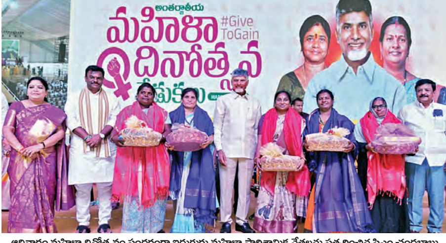
అదివారం మహిళా దినోత్సవం సందర్భంగా విద్యార్థులు మహిళా పాలిట్రామిక వేత్తలను సత్కరించిన సీఎం చంద్రబాబు

పలు హోటళ్లపై బిల్లుల ఎగవేత ఆరోపణలు పలువురిపై కేసులు నమోదు విజయవాడ, మూర్తి 8: ప్రభాతవార్ ప్రతినిధి: రాష్ట్రవ్యాప్తంగా పలు ప్రాంతాల్లో రెస్టారెంట్లపై ఐటీ అధికారులు దాడులు నిర్వహిస్తున్నారు. రాజమండ్రి, నెల్లూరు, విశాఖ పట్నం, విజయవాడ, గుంటూరు, శ్రీకాకుళం ప్రాంతాల్లోని పలు రెస్టారెంట్లలో ఐటీ సోదాలు చేపట్టారు. ట్యాక్స్ కట్టకుండా బిల్లులు ఎగ్గడమన్నారని ఈ రెస్టారెంట్లపై, హోటళ్ల యాజమాన్యాలపై ఆరోపణలు వచ్చాయి. ఈ సేవల్లో అదివారం ఆకస్మిక ఐటీ దాడులు జరిగాయి. ఈ క్రమంలో కంప్యూటర్ డేటాను ఐటీ అధికారులు పరిశీలిస్తున్నారు. ప్రధానంగా ఆన్లైన్ పేమెంట్స్, డిజిటల్ డేటాను పరిశీలిస్తున్నారు. ఇటీవల రూ.70వేల కోట్ల అమ్మకాల డిజిటల్ రికార్డులను పలు హోటళ్ల, రెస్టారెంట్ల యజమానులు తొలగించారని సమాచారం. ఈ క్రమంలో కీలక ఆధారాలని ఆదాయ సమన్వయ అధికారులు