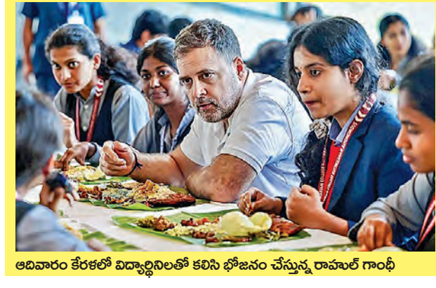
అదివారం కేరళలో విద్యార్థులలో కలిసి భోజనం చేస్తున్న రాపూల్ గాంధీ