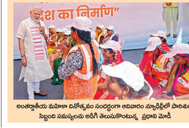
అంతర్జాతీయ మహిళా దినోత్సవం సందర్భంగా అదివారం న్యూఢిల్లీలో పాలిట్రామిక నిర్మాణం సమస్యలను అధిగె తెలుసుకొంటున్న ప్రధాని మోడీ

మహిళలకు తెలివి ఎక్కువ దీర్ఘకాలిక అలోచనలు చేస్తారు.. మహిళలు బాస్లుగా ఉన్న కుటుంబంలో పెరిగా: రాపూల్