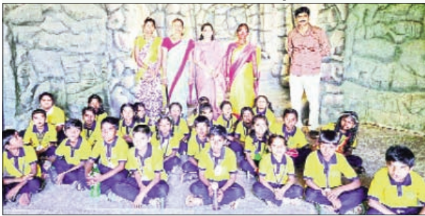
బచ్చన్నపేట, మార్చి 8 ప్రభాతవార్త :

విద్యార్థులకు విజ్ఞాన విహారయాత్రలు తరగతి గది అభ్యసనను ఆచరణాత్మకంగా మార్చే అద్భుత అవకాశంగా సరదాగా సంతోషంగా ఉంటుందని మండల ప్రాథమిక పాఠశాల ప్రధానోపాధ్యాయులు భాగ్యవి తెలిపారు. ఈ సందర్భంగా ఆమె మాట్లాడుతూ నారాయణపురం ప్రాథమిక పాఠశాల విద్యార్థులను డైనోసార్ పార్క్, కోమటి చెరువులో బోటింగ్, పార్కులో సరదాగా సంతోషంగా ఆటలు ఆడించామన్నారు. విహారయాత్రలు చారిత్రక, శాస్త్రీయ, పర్యాటక ప్రదేశాలను సందర్శించడం ద్వారా ప్రత్యక్ష అనుభవాన్ని అందిస్తాయన్నారు. తద్వారా విద్యార్థుల్లో ఆలోచనావిధానం, సృజనాత్మకత, నైపుణ్యాలు పెరుగుతాయన్నారు. విద్యార్థుల విహారయాత్రలకు సహకరించిన చిన్నారుల తల్లిదండ్రులకు ప్రత్యేక కృతజ్ఞతలు తెలిపారు. ఈ కార్యక్రమంలో పాఠశాల ఉపాధ్యాయులు, విద్యార్థులు పాల్గొన్నారు.