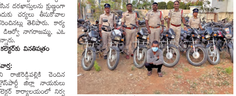
స్వాధీనం చేసుకున్న ద్వితీయ వాహనాలు, నిందితుని చూపుతున్న గజ్వేల్ పోలీసులు