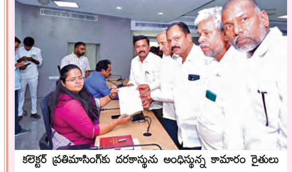
కలెక్టర్ ప్రతిపాదనలకు దరఖాస్తును అందిస్తున్న కామారం రైతులు

బిస్కనంతరంపేట, మార్చి 9, ప్రభాతవార్త: కొండపోచమ్మ కాలన నిర్మాణం పూర్తి అయితే పంటబోలాలకు నీళ్లు వస్తాయని ఆకంబిన తమకు నిరాశ మిగిలిన బిస్కనంతరంపేట మండల కామారం రైతులు ఆవేదన వ్యక్తం చేస్తున్నారు. గతప్రభుత్వం కొండ పోచమ్మ కాలన నిర్మాణానికి సాగుభూమి 40 ఎకరాలను అందించాను న్నారు. గ్రామ శివారు వరకు 90శాతం పనులు పూర్తి అయ్యాయని, మిగిలిన పనులను పూర్తిచేసి రైతులకు నీళ్లు అందించాలని గ్రామస్థాయి సోమవారం ప్రజావాణిలో కలెక్టర్ ప్రతిపాదనలకు దరఖాస్తుచేశారు. కొండపోచమ్మ కాలన నిర్మాణం పూర్తి అయితే లక్షల ఎకరాల పంట భూమికి నీళ్లు అందుతాయని, రైతులకు నీళ్ల కష్టాలు పోతాయని, అధికారులు చర్యలు తీసుకోవాలని రైతులు కోరారు.