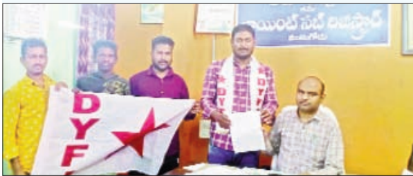
మునుగోడు మార్చి 09 ప్రభాత వార్త

నమోదు కేంద్రాలపై చట్టపరమైన చర్యలు తీసుకోవాలి .