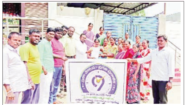
చిట్యాల రూరల్, మార్చి 09, ప్రభాతవార్త :