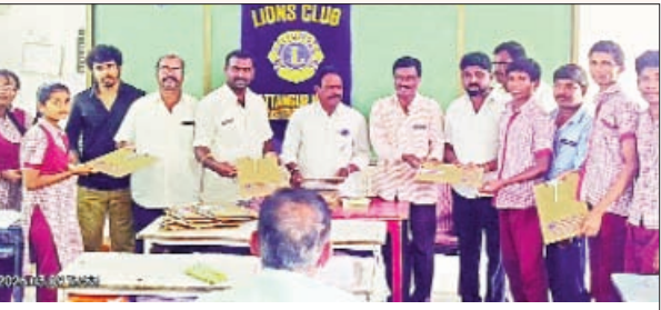
కట్టంగూర్, మార్చి 9, ప్రభాతవార్త,