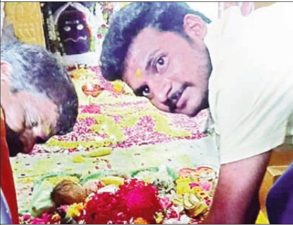
నిడమనూరు ప్రభాతవార్త మార్చి 9