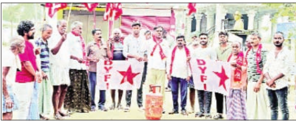
చౌటుప్పల్, మార్చి 9 ప్రభాతవార్త.