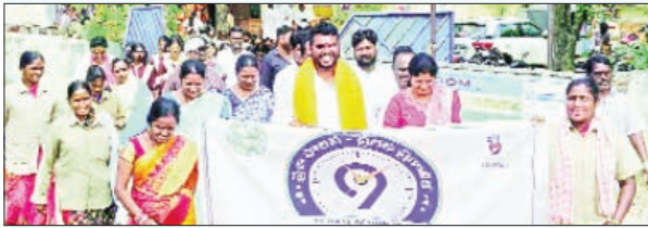
నార్కట్ పల్లి ప్రభాతవార్త మార్చి 09