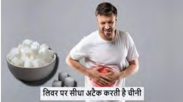
लिवर पर सीधा अटैक करती है चीनी

कोल्ड ड्रिंक, पैकड जूस, एनर्जी ड्रिंक, मिठाइयां, बेकरी प्रोडक्ट और प्रोसेस्ड फूड में छिपी एकस्ट्रा शुगर धीरे-धीरे शरीर के सबसे जरूरी अंगों में से एक लिवर को प्रभावित करने लगती है। ज़रूरत से अधिक चीनी के सेवन से फैटी लिवर, फाइब्रोसिस और डायबिटीज जैसी बीमारियां हो सकती हैं। हेल्दी डाइट और एक्टिव लाइफस्टाइल से इन रोगों से बचा जा सकता है।