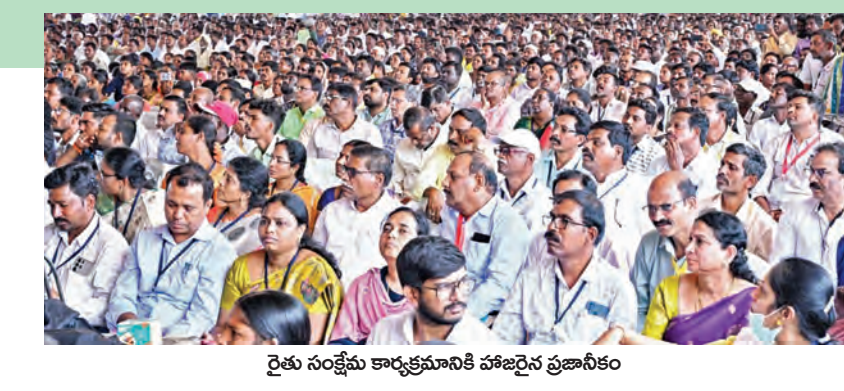
రైతు సంక్షేమ కార్యక్రమానికి హాజరైన ప్రజాసీఎం

సోమవారం బురుజుగ్రామంలో రైతుకు పట్టణాధికారి పాస్ పుస్తకం అందచేస్తున్న సీఎం చంద్రబాబు డోన్, మార్చి 9 ప్రభాతవార్త: ఎన్నికల ముందు రాష్ట్ర ప్రజలకు సూపర్ సిక్స్ పథకాలలో భాగంగా ఎవైతే హామీ ఇచ్చామో వాటిని తూచ తప్పకుండా అమలు చేస్తున్నామని ముఖ్యమంత్రి చంద్రబాబు నాయుడు అన్నారని సోమవారం డోన్ నియోజకవర్గంలోని కొత్త బురుజు గ్రామంలో పట్టణాధికారి పాస్ పుస్తకాల పంపిణీ కార్యక్రమంలో పాల్గొని ముఖ్యమంత్రి చంద్రబాబు నాయుడు