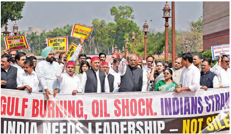
సోమవారం పార్లమెంటు ముందు ధర్నా నిర్వహిస్తున్న విపక్ష ఎంపిలు