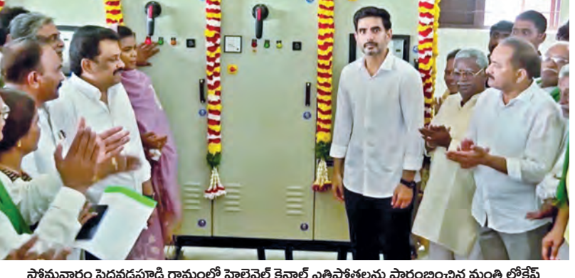
సోమవారం పెద్దపల్లపూడి గ్రామంలో హైలెవెల్ కెనాల్ ఎత్తిపోతలను ప్రారంభించిన మంత్రి లోకేశ్