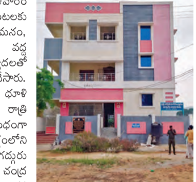
కంచి శృంగేరి పీఠాధిపతి శ్రీకాళహస్తి సందర్శించనున్న భవనం

సాగనుంది. మంగళవారం సాయంత్రం 6 గంటలకు జగద్గురు ఆగమనం, జలవిసాయక ఆలయం వద్ద దేవస్థానం మర్యాదలతో ఘనస్వాగతం ఏర్పాటు చేసారు. స్వామి దేవాలయం ధూళి దర్శనం. తదనంతరం రాత్రి దేవస్థానంకు అనుబంధంగా ఉన్న భద్రాక్షాత్ర తీర్థంలోని గంగా అనంత జగద్గురు జరుపుకునే సందర్భంలో మౌళికపూజలు మార్చి 11 బుధవారం ఉదయం 10 గంటలకు శ్రీజ్ఞాన ప్రసూనావనమేత శ్రీకాళహస్తిలోని దర్శనం, విశేష అభిషేకాలు, అర్చనలు 11 గంటలకు గంగా నదీలో జగద్గురు వందన సభ ఆనుగ్రహ భావణం, భక్తులకు దర్శనం, పాదపూజలు, మధ్యాహ్నం 12.30 గంటల నుంచి భక్తులకు భోజన ప్రసాదాలు, సాయంత్రం 5 గంటలకు తిరుపతి పయనం ఏర్పాటు చేసినట్లు అధికారికంగా ప్రకటించారు.