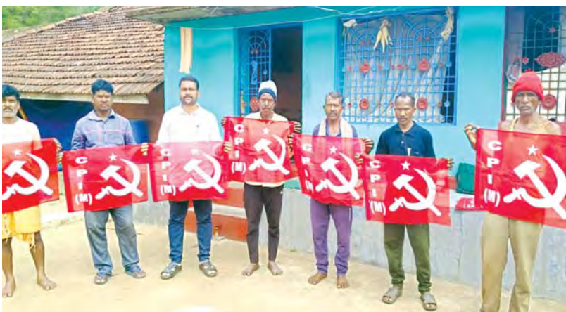
చుట్టినగడ మార్చి 09 ప్రభాతవార్త