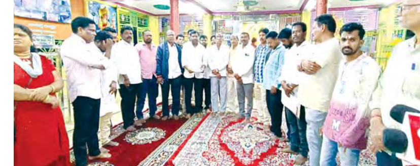
పాఠశాల మార్చి 09 ప్రభాతవార్త