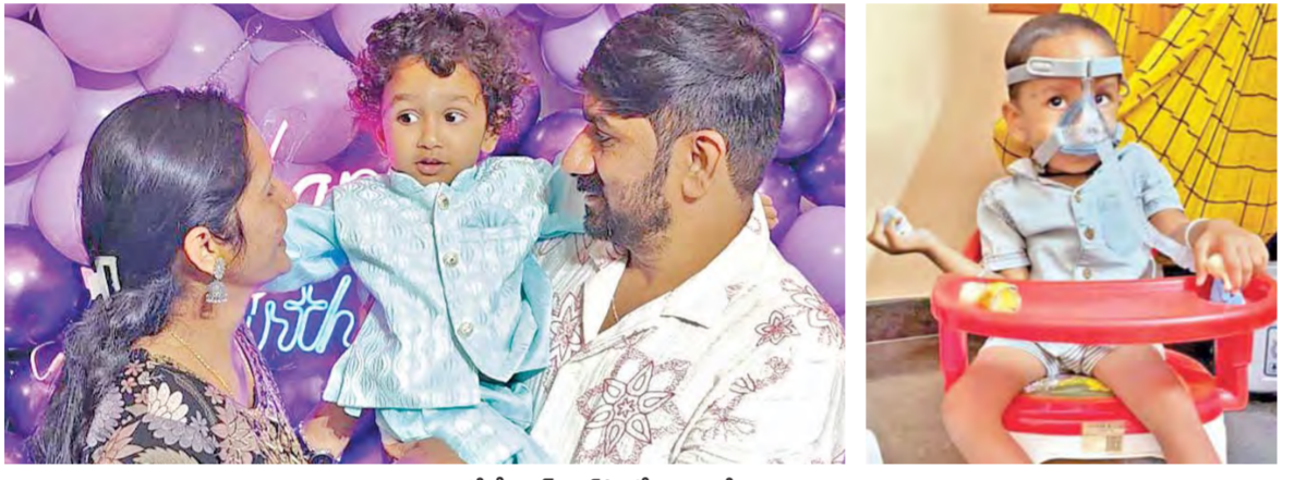
తల్లిదండ్రులతో కేయాస్, డ్రెస్ ఫోటో, వ్యాజ్ తో బాధపడుతున్న దృశ్యం

అంగీకరించిన యూనివర్సిటీల వినియోగం హైదరాబాద్, మార్చి 9, ప్రభాతవార్త: రాష్ట్రంలో రానున్న 2026-27 విద్యా సంవత్సరం నుంచి డిగ్రీలో సిలబస్ కొంత మేరకు తగ్గుతుంది. 2025-26 విద్యా సంవత్సరం వరకు డిగ్రీలో కొనసాగిన సిలబస్ నుంచి కొంత తగ్గించాలని ఉపకులపతి(డీసీ) మీడింగ్లో కొనసాగించారు. ఇప్పటి వరకు డిగ్రీ కోర్సులో కోర్సు పూర్తయ్యే నాటికి 142 క్రెడిట్స్ కొనసాగుతుండగా.. ఇకపై 2026-27 విద్యా సంవత్సరం నుంచి క్రెడిట్స్ ను 120కి తగ్గించాలని నిర్ణయించారు. తెలంగాణ ఉన్నత విద్యా మండలి యూనివర్సిటీల మీటింగ్లో రెండు రోజుల క్రితం నిర్వహించిన సమావేశంలో ఈమేరకు నిర్ణయం తీసుకున్నారు. యూనివర్సిటీ గ్రాంట్స్ కమిషన్(యుజిసీ) నిబంధనలను ఎక్కడా మీరకుండా.. సిలబస్ తగ్గిస్తూ.. క్రెడిట్స్ ను తగ్గించాలని నిర్ణయించారు. ప్రస్తుతం డిగ్రీల మూడు సంవత్సరాల కోర్సు 142 క్రెడిట్స్ తో పూర్తి కానుంది. వాటిల్లో మొదటి సెమిస్టర్ నుంచి 4వ సెమిస్టర్ వరకు 25 క్రెడిట్స్ చొప్పున 100 క్రెడిట్స్ పూర్తివుతాయి. డిగ్రీ కోర్సు చివరి ఏడాదిలో సెమిస్టర్ కి 21 క్రెడిట్స్ చొప్పున మరో 42 క్రెడిట్స్ తో కలిపి మొత్తం 142 క్రెడిట్స్ తో డిగ్రీ కోర్సును పూర్తి చేస్తున్నారు. అయితే 2026-27 విద్యా సంవత్సరం నుంచి డిగ్రీ కోర్సులో ప్రతి సెమిస్టర్ కి 20 క్రెడిట్స్ చొప్పున మొత్తం 120 క్రెడిట్స్ ను కొనసాగించాలని నిర్ణయించారు. అలాగే ఓటీ కోర్సుల్లో కూడా ఇలాగే ప్రతి సెమిస్టర్ కి 20 క్రెడిట్స్ చొప్పున మొత్తం 80 క్రెడిట్స్ తో ఓటీ కోర్సు పూర్తి కానుంది.