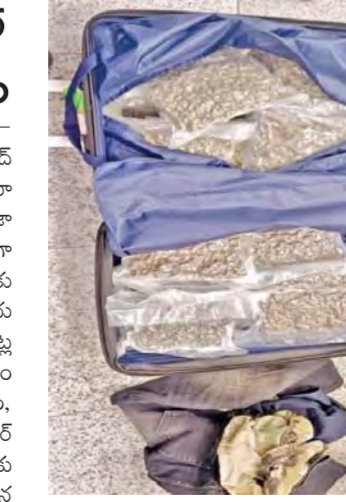
పట్టుబడిన గంజాయి ప్యాకెట్లు

రంగారెడ్డి లెఫ్టినెంట్, మార్చి 9, ప్రభాతవార్త: శంషాబాద్ లోని రాజ్ కేంద్రం అంతర్జాతీయ విమానాశ్రయంలో కస్టమ్స్ అధికారులు భారీ గంజాయిని పట్టుకున్నారు. విదేశాల నుంచి ఆక్రమణకు మాదకద్రవ్యాలను తరలించే వేదంకు ప్రయత్నించిన ఇద్దరు ప్రయాణికులను అదుపులోకి తీసుకొని వారి వద్ద నుంచి కోట్ల రూపాయల విలువైన గంజాయిని స్వాధీనం చేసుకున్నారు. అధికారులు వివరాల ప్రకారం, హాఫీయ నుంచి కొర్రాపల్లి మీదగా ఎయిర్ ఏషియా ఏఐ-069 విమానంలో హైదరాబాద్ వచ్చిన ఇద్దరు ప్రయాణికుల ప్రవర్తన అనుమానాస్పదంగా కనిపించడంతో కస్టమ్స్ అధికారులు ప్రత్యేక తనిఖీలు చేపట్టారు. వారి లగజీజీని స్వాధీనం చేయగా అనుమానాస్పద వస్తువులు కనిపించాయి. దీంతో అధికారులు లగజీజీని పూర్తిగా తనిఖీచేయగా, అందులో నిషేధిత