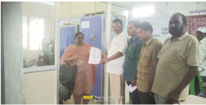
చుట్టినగడ మార్చి 09 ప్రభాతవార్త

మండల కేంద్రంలోని అంబేద్కర్ విగ్రహ ఏర్పాటుకు స్థలం కేటాయింపు కోసం తహశీల్దార్ కు వినతి పత్రం సమర్పించింది. తహశీల్దార్ కు వినతి పత్రం సమర్పించింది. తహశీల్దార్ కు వినతి పత్రం సమర్పించింది.