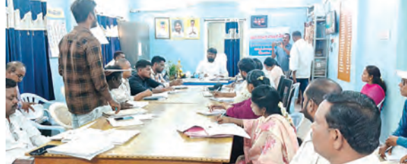
డీలర్ల సమావేశంలో మాట్లాడుతున్న తహసీల్దార్