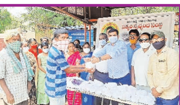
అప్పటినుండి ఇప్పటివరకు ఆ సేవా కార్యక్రమం మరింత విజయవంతంగా కొనసాగుతోంది. ఆర్థిక ఒడిదుడుకులు ఎదురైన ప్రస్తుతం అన్ని నిత్యవసరాల ధరలు పెరిగిన కానీ వాటిని లో క్క చో య కుం డా

వాళ్లు ఎవరు?.. ఆవదలో ఎవరు తోడుగా ఉంటారు.. అని.. ఆలోచించే రోజులు పోయాయి ప్రతిక్షణం డబ్బు సంపాదన ప్రతి నిమిషం ఏ విధంగా ఉపయోగిస్తే ఎంత లాభం వస్తుందని పరుగులు పెట్టే ఈ సమాజంలో ఒక కుటుంబం మొత్తం నిరుపేదల ఆకలి తీర్చడానికి నడుచుకుంటుంది. స్వయానా వారి తమ చేతులతో వండి రుచికరమైన భోజనాన్ని అందిస్తూ అందరి మన్ననలు పొందుతున్నారు. కరోనా సమయంలో అందరూ ఇళ్ళకే పరిమితమైతే పారిశుద్ధ్య కార్యక్రమం, రోడ్డు పక్కన యాచించేవారు, ఇతర ప్రాంతాల నుంచి వలస వచ్చిన వారు, వేరే ప్రాంతాల వెళ్లి తమ స్వగ్రామానికి చేరుకోవడానికి ఇబ్బందులు పడుతున్న వారు... ఇలా అభిగ్రంథితులందరినీ చూసి చలించిపోయారు. ఎలాగైనా వారి ఆకలి తీర్చాలని సత్యం సంస్థను ఏర్పాటు చేసుకున్నారు. కుటుంబంలో అందరూ కలిసి ఒక విందు భోజనం తయారు చేసినట్లు రుచికరమైన భోజనాన్ని తయారు చేస్తూ నామమాత్రంగా కాకుండా హృదయపూర్వకంగా వండి వడ్డించారు.