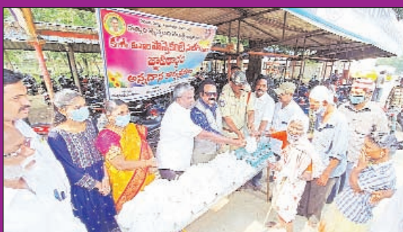
కరోనా సమయంలో సత్యం సత్యం సంస్థ ఆధ్వర్యంలో సత్యం స్వచ్ఛంద సంస్థ ఆధ్వర్యంలో రైల్వే స్టేషన్ పరిసరాలలో మరియు బ్యాండ్ పరిసరాలలో ఉన్న టీడలకు భిక్షాటన చేయబడుతున్న వారికి పోలీసు ఉన్నతాధికారులచే అన్నదాన కార్యక్రమం నిర్వహించిన పొన్నెకంటి సంజీవరాజు జయ కుమారి సమత వర్షిత

అసలు మనిషి అంటే ఏంటి మనిషి విలువ ఎంత నా అనే