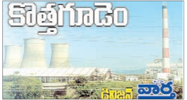
చంచుపల్లి, జూలూరుపాడు, సుజాతనగర్