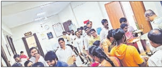
సిబ్బంది మధ్య ఐక్యత, సహకారం మరింత బలపడింది.

కోత్తూరు, మార్చి 10 ప్రభాతవార్త: శ్రమదానం కార్యక్రమం సందర్భంగా మంగళవారం జిల్లా వైద్యాధికారి కార్యాలయంలో సమిష్టి భోజనం కార్యక్రమం నిర్వహించబడింది. ఈ కార్యక్రమంలో కార్యాలయంలోని అధికారులు, సిబ్బంది పాల్గొన్నారు. అందరూ కలిసి సమిష్టిగా భోజనం చేసి ఐక్యతను ప్రదర్శించారు. ఆనంతరం శ్రమదానం కార్యక్రమంలో భాగంగా కార్యాలయ పరిసరాలను సిబ్బంది అందరూ కలిసి శుభ్రపరిచారు. కార్యాలయాన్ని పరిశుభ్రంగా ఉంచుకోవడం ప్రతి ఒక్కరి బాధ్యత అని అధికారులు ఈ సందర్భంగా తెలిపారు. ఈ కార్యక్రమం ద్వారా పరిశుభ్రతపై అవగాహన పెంపొందించడంతో పాటు కార్యాలయ