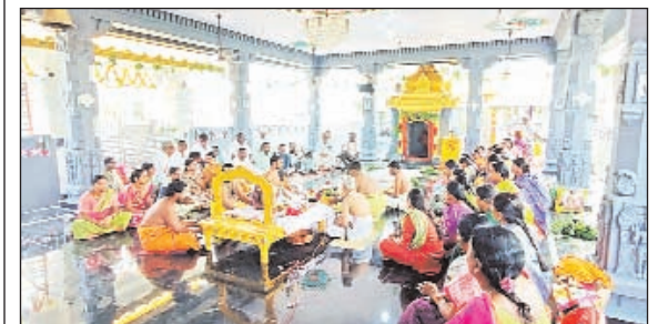
మొండికుంట గ్రామంలోని శ్రీ శ్రీ సీతారామచంద్ర స్వామి ఆలయ మొదటి వార్షిక బ్రహ్మాత్మవాలూ అత్యంత అంగరంగ వైభవంగా, ప్రారంభమయ్యాయి. బ్రహ్మాత్మవాలూలో భాగంగా మంగళవారం ఆలయంలో ఉదయం పూట అగ్ని ప్రతిష్ఠ, భృజాలోహణం, చతుస్థానార్చనం, కంకణ ధారణ వంటి కార్యక్రమాలు నిర్వహించారు. ఈ సందర్భంగా గ్రామం లో ఒక పండుగ వాతావరణం నెలకొంది. ఆధ్యాత్మికత ఉట్టిపడుతూ, శ్రీరామ నామస్మరణ తో గ్రామం హోరెత్తుతోంది. భక్తులు భక్తి శ్రద్ధలతో, నియమ నిష్ఠలతో పూజా కార్యక్రమాల్లో పాల్గొంటున్నారు. వేద పండితులు సమక్షంలో పూజా కార్యక్రమాలు నిర్వహిస్తున్నారు. మార్చి 9 నుండి ప్రారంభమైన ఈ బ్రహ్మాత్మవాలూ 12 వ తారీఖు వరకు కొనసాగనున్నాయి. 11 వ తారీఖున సీతారామల కల్యాణం జరగనున్నట్లు, కళ్యాణ అనంతరం మధ్యాహ్నం మహా అన్నదాన కార్యక్రమం నిర్వహించనున్నట్లు, ఈ బ్రహ్మాత్మవాలూలో అశోకం పాల్గొని విజయవంతం చేయాలని, భక్తులు ఇబ్బందులు పడకుండా అన్ని సౌకర్యాలు, వసతులు ఏర్పాటు చేశామని సీతారామ చంద్రస్వామి ఆలయ కమిటీ, బ్రహ్మాత్మవాలూ నిర్వహణ కమిటీ తెలిపారు.

- మార్క్సిస్టు గుతున్న శ్రీరామ నామస్మరణ అశ్వాపురం, ప్రభాతవార్త, మార్చి 10: