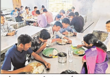
పరిశీలించారు పాఠశాలలో విద్యార్థులు అందిస్తున్న భోజనాన్ని నాణ్యత పరిశుభ్రత మెనూ విధానాన్ని జిల్లా కలెక్టర్ ఆదేశానుసారం సందర్శించినట్లు అధికారులు తెలిపారు