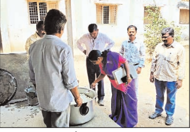
విద్యార్థులకు పరీక్షల సమయం కావడంతో భోజనాలలో నాణ్యత పరిశుభ్రత మెనూ పాటించాలని అలసత్వం వహిస్తే చర్యలు తప్పవని పలు సూచనలు చేశారు.