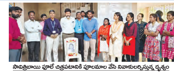
సావిత్రిబాయి పూలే ఉత్సవాలకు వీడ్కోలు సమావేశం ఏర్పాటు చేసిన దృశ్యం

నర్స, మార్చి 10 ప్రభాతవార్త: పదో తరగతి ప్రయాణం... వెలకట్టల సన్నపేట... కన్నతండ్రిలా విద్యార్థులు నేర్పిన గురువులు.. ఇవన్నీ ఒక ఎత్తితో, ఇప్పుడు అగడప దాటి వెళ్తున్నారని బాధపడి ఎత్తు, నారాయణ ఎలు జిల్లా నర్స మండల కేంద్రం లోని జిల్లా పరిషత్ ఉన్నత పాఠశాలలో మంగళవారం జరిగిన 10వ తరగతి విద్యార్థుల వీడ్కోలు సమావేశం అత్యంత భావోద్దీగంగా మధ్య జరిగింది. 9వ తరగతి విద్యార్థులు పదో తరగతి విద్యార్థులకు ఏర్పాటు చేసిన ఈ వీడ్కోలు సమావేశం కేవలం వేడుకగానే కాకుండా అత్యంత కలయికా మారించి, పాఠశాల ప్రాంగణంలో గడిపిన ప్రతి క్షణం విద్యార్థుల కళ్లముందు కదలాడాయి. తమను తీర్చిదిద్దిన ఉపాధ్యాయులకు సమర్పించిన విద్యార్థులు కృతజ్ఞతలు తెలిపారు. ఈ సందర్భంగా తొమ్మిదో తరగతి విద్యార్థులు పదో తరగతి విద్యార్థులకు శుభాకాంక్షలు తెలియజేస్తూ వారి భవిష్యత్తు విజయవంతంగా ఉండాలని మంత్రి పంతులు సాగునీరు కార్యక్రమాలు, ప్రస్తుతం నిర్వహించిన పదో తరగతి విద్యార్థులకు ఉపాధ్యాయులను అభినందించారు. విద్యార్థుల సేవలతరగతి గదిలో సందడి, ఆటస్థలంలో కేరింతలు, భోజనాలు పంపి కన్న రోజులను గుర్తు చేసుకుంటూ ఒకరినొకరు కొనింపించుకుని వీడ్కోలు చెప్పారు. రేపు పాఠశాల గంట మోగితే తాము ఆకృష్ట ఉండమన్న ఆలోచన వారిని కలిపింది. అయితే తమ సీనియర్ భవిష్యత్తు బంగారు మయంగా ఉండాలని 9వ తరగతి విద్యార్థులు ఆకాంక్షించి వారిని సాగనంపారు. వీడ్కోలు అంటే విడిపోవడం కాదు : కొత్త శిఖరాలను అధిరోహించడం