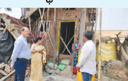
ఇందిరమ్మ ఇళ్లను పరిశీలించు అందసపు కలెక్టర్

దామరగడ్డ, మార్చి 10 ప్రభాతవార్త : ఇందిరమ్మ ఇళ్ల నిర్మాణ పనులను వేగంగా పూర్తి చేసి గృహప్రవేశ కార్యక్రమాలకు సిద్ధం చేయాలని అదనపు కలెక్టర్ (స్థానిక సంస్థలు) ఫణిశంకర్ రెడ్డి సలహానిచ్చి అధికారులను ఆదేశించారు. మంగళవారం దామరగడ్డ మండలంలోని దామరగడ్డ గ్రామపంచాయతీలో కొనసాగుతున్న ఇందిరమ్మ ఇళ్ల 99 రోజుల కార్యక్రమం ప్రజలకు పనులను ఆయన పరిశీలించారు. ఈ సందర్భంగా నిర్మాణ పనుల పురోగతిని అధికారులను అడిగి తెలుసుకున్నారు. ఇందిరమ్మ ఇళ్ల నిర్మాణ పనులు త్వరితగతిన పూర్తి చేసి అభివృద్ధులకు గృహప్రవేశ కార్యక్రమాలు నిర్వహించేందుకు సిద్ధం చేయాలని సూచించారు. ప్రభుత్వం నిర్ణయించిన గడువులోగా పనులను పూర్తి చేయాలని స్పష్టం చేశారు. ఈ కార్యక్రమంలో ఎంపీడీవో, పోసింగ్ అధికారులు, గ్రామ పంచాయతీ అధికారులు తదితరులు పాల్గొన్నారు.