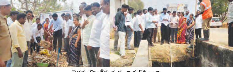
చెత్తను తొలగిస్తున్న మునిపల్లె నిబ్బంది