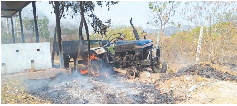
డంపింగ్ యార్డ్ వద్ద కారుపాటు ట్రాక్టర్

◆ పంచాయతీ ట్రాక్టర్ డ్రగ్గం ◆ రామకృష్ణపల్లి డంపింగ్ యార్డ్ వద్ద ఘటన