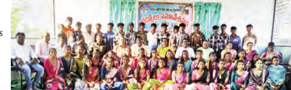
పదో తరగతి విద్యార్థులకు వీడ్కోలు సమావేశం ఏర్పాటు చేసిన దృశ్యం