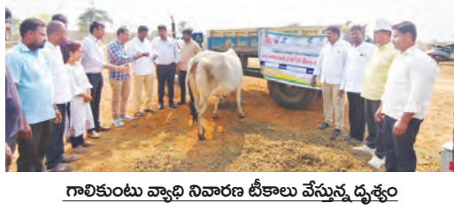
గాలికుంటు వ్యాధి నివారణ టీకాలు వేస్తున్న డక్టర్