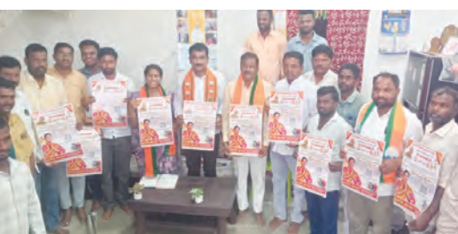
ప్రధానమంత్రి ఖేల్ సంసాన్ మహోత్సవ గోడ వృత్తి విడుదల