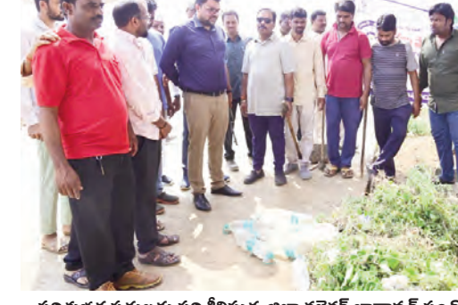
పరిశుభ్రత పనులను పరిశీలిస్తున్న జిల్లా కలెక్టర్ బాదావత్ సంతోష్

నాగర్ కర్నూల్ ప్రతినిధి, మార్చి 10 ప్రభాతవార్త: రాష్ట్ర ప్రభుత్వం ఎంతో ప్రతిష్టాత్మకంగా చేపడుతున్న 99రోజుల ప్రజా పాలన ప్రగతి ప్రణాళికను అభ్యుపేక్షించి మున్సిపాలిటీలో సమర్పవంతంగా అమలు చేయాలని నాగర్ కర్నూల్ జిల్లా కలెక్టర్ బాదావత్ సంతోష్ మున్సిపల్ శాఖ అధికారులను ఆదేశించారు. మంగళవారం అభ్యుపేక్షించిన పట్టణంలోని 3వ వార్డు హిందూ స్మశాన వాటికలో ప్రజా పాలన ప్రగతి ప్రణాళిక 99 రోజుల కార్యక్రమంలో భాగంగా మున్సిపల్ శాఖ అధికారుల ఆధ్వర్యంలో చేపట్టిన శుశానంలో ముఖ్యమంత్రి తొలిసారి, పరిశుభ్రత కార్యక్రమాలను నాగర్ కర్నూల్ జిల్లా కలెక్టర్ బాదావత్ సంతోష్ పరిశీలించారు. స్మశాన వాటికలోని ముఖ్య కంపెనెట్లను, పిప్పిమొక్కలను తొలగించి పరిశుభ్రంగా ఉండేలా చూడాలని, దహన సంస్థానాలకు వచ్చే ప్రజలకు ఇబ్బందులు కలుగకుండా దారి వసతులను ఏర్పాటు చేయాలని మున్సిపల్ కమిషనర్ ను