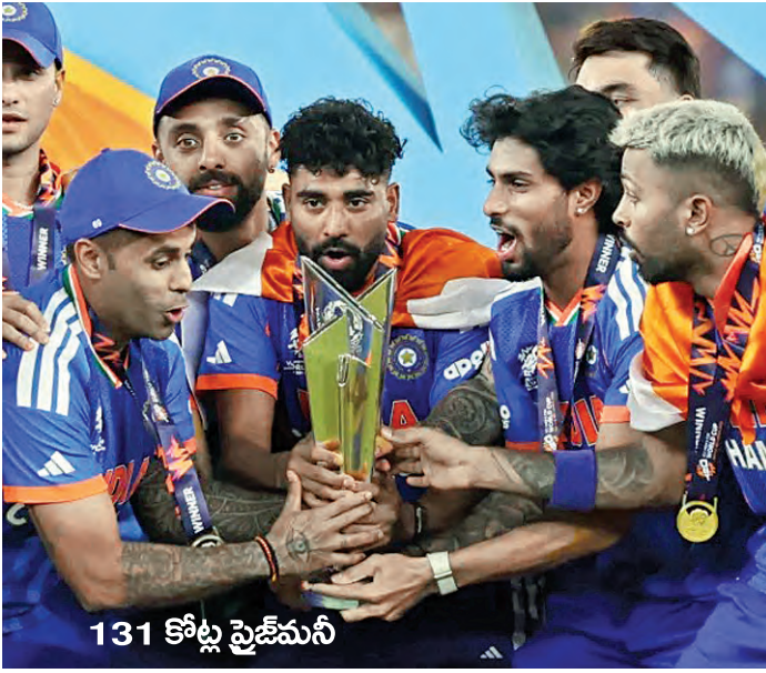
131 కోట్ల ప్రజేమనీ