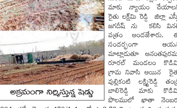
అక్రమంగా నిర్మిస్తున్న ఇండ్లు