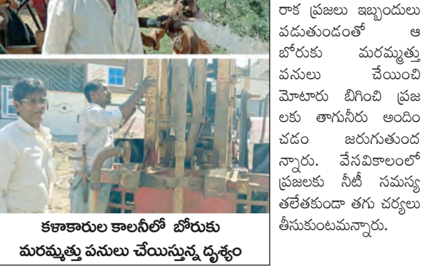
కళాకారుల కాలనీలో జోరుకు మరమ్మత్తు పనులు చేయిస్తున్న ద్యక్షం