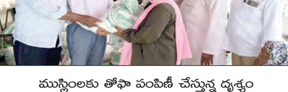
ముస్లింలకు తోఫా పంపిణీ చేస్తున్న ద్యక్షం