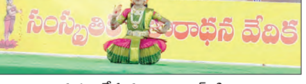
నృత్యం చేస్తున్న చిన్నారు ఎల్.టి.పి.కా