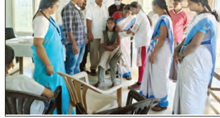
టీకాలు వేస్తున్న దృశ్యం