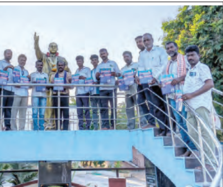
నిరసన వ్యక్తం చేస్తున్న సాకే హరి తదితరులు