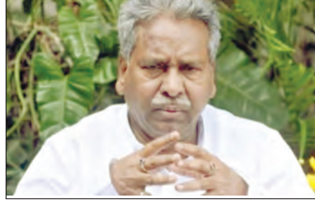
మాజీ మంత్రి కావూరి సాంబశివారావు