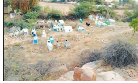
స్వశాసన వాటికకు ప్రహారీ గోడ లేని దృశ్యం

శింగనమల, మార్చి 11 ప్రభాతవార్త మండల కేంద్రంలోని గోల్కొండ కింద ఉన్న స్వశాసన వాటికకు ప్రహారీ ఏర్పాటు చేయాలని పలువురు గ్రామస్థులు అధికారులను కోరుతున్నారు. అంత్య క్రియలు చేసిన పిదప స్వశాసన వాటికలో నీటి వసతి లేక వచ్చిన వారు తీవ్ర ఇబ్బందులు ఎదుర్కొంటున్నారు. ఒక ప్రత్యేక గదిని కూడా నిర్మించాలని అన్ని సామాజిక వర్గాలు ఇక్కడ అంత్య క్రియలు నిర్వహిస్తున్న ఎదున