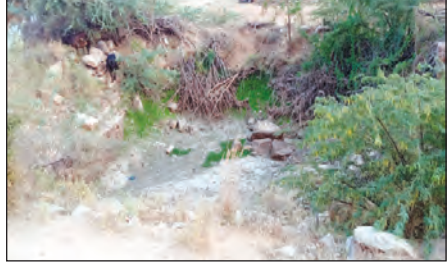
స్వశాసనలో నీరు లేక ఎండిన బావి