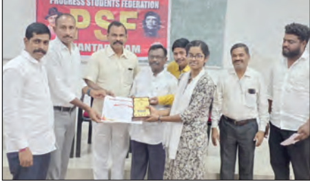
బహుమతులను అందజేస్తున్న దృశ్యం