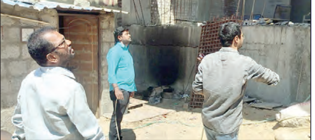
భవన నిర్మాణాలను పరిశీలిస్తున్న