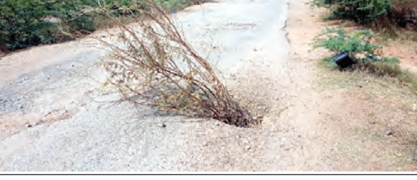
కల్వర్షుకు రంధ్రం పడిన దృశ్యం

శింగనమల, మార్చి 11 ప్రభాతవార్త మండల పరిధిలోని కల్వర్షు గ్రామం నుంచి గుమ్మెపల్లి గ్రామం వరకు రహదారి మధ్యలో కల్వర్షుకు రంధ్రం పడి ప్రయాణికులకు ప్రమాదకరంగా తయారైంది. ఇరు గ్రామాల ప్రజలు నిత్యం ద్వితీయ వాహనాల్లో వెళ్తూ, టీకెటీ సమయంలో కల్వర్షు రంధ్రంలో వాహనం పడి గాయాలకు గురవుతున్నారని ప్రజలు వాపోతున్నారు. కొందరు ప్రజలు ఇబ్బంది పడరాని కల్వర్షుకు పడిన రంధ్రంలో ఎండిన ముల్లకల్వర్షులు ఉండాలి. ఇప్పటికైనా అధికారులు స్పందించి కల్వర్షుకు ఏర్పడిన రంధ్రాన్ని పూడ్చి వేసి ప్రజలను ఆపాయనం చేసి కార్యాచరణ కోరుతున్నారు.